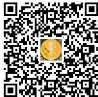
町「狐の嫁入り行列」ページ