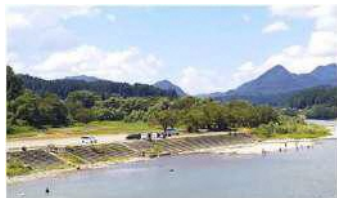
常浪川と公園全景