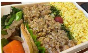
幻の駅弁「とりめし」

昨年、乗車人数100万人を達成した「SLばんえつ物語」。その運行にあわせ、今年もJR津川駅では多くの来訪者をお迎えします。