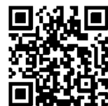
あがまちファンクラブ Instagram

阿賀町まちづくり観光課 〒959-4495 新潟県東蒲原郡阿賀町津川580番地 TEL：0254-92-4766 Mail：agamachi_oen@town.aga.lg.jp