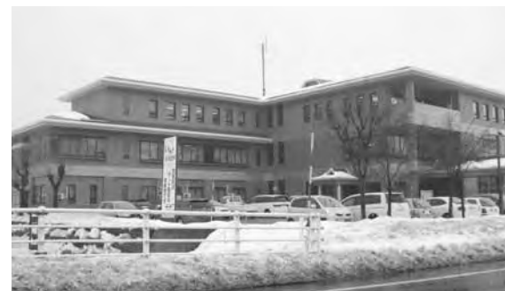
臨時職員の採用を

町長 財政上残業時間のカットも 考えていることですが、 それでもなおかつ見込まれる 時間外労働は、臨時職員を雇 って一人でも多くの人に、働 く場を与えるべき（ワークシ ェアリング）と思いますが、 いかがでしょうか。 質問 (1)町でもできる 景気対策 ワークシェアリング 臨時職員の採用を