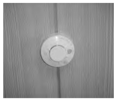
警報器設置に助成を

【町長】 ご提案ありました火災警報器の設置助成制度についてはさまざまケースが想定されます。難聴の方は回転灯のような装置の付いたものや、警報音を察知した場合にすぐ家族または近隣にすぐ周知できるように警報器があるのではないかと。一度に全世帯ということができないとすれば、そういった弱者の皆さんから取り組んでいくことがあってもいいのではないかと思いい検討させていただきます。