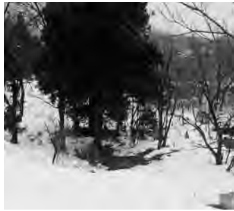
(丈山地内の現況) 対岸には立派な堤防が、排水が民地に