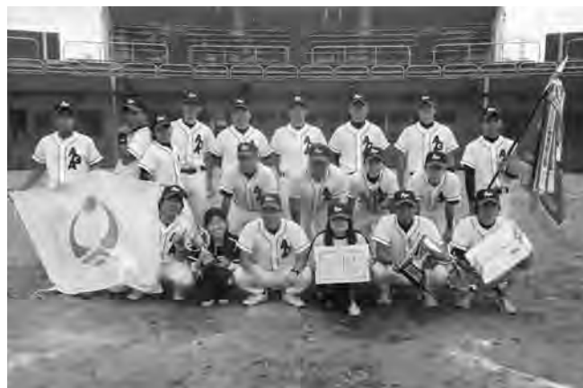
優勝時の記念撮影