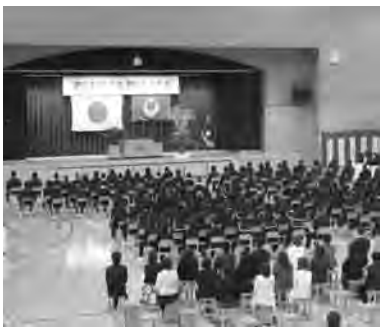
肉声音が聞きとりにくい…

まとめ 穴あき板の使用、音響設備の利用、遮光カーテン、吸音の良い暗幕等の使用が考えられるが、今後の調査を待ちたい。