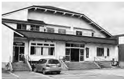
上川温泉(みかぐら荘)

町長 純然たる商業活動をしてい るところに、指定管理料とは 何だろうという疑問を抱かさ るを得ない。 少なくとも、施設の火災保 険や、ガス・電気、施設等の 保安料、調理用の風洞施設等 は、施設利用をしている指定 管理者が負担すべきと思いま す。これら指定管理料は見直 されるべきと思いますが如何 ですか。 町長 地域の方々が就労している ことにも経済効果を見い出せ る訳ですので、行政が支援し ていきながらやることも意味 のあることだと思います。