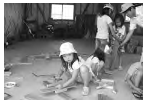
何をつくるのかな...

世代育成支援行動計画で二一ズ調査を実施する 町長 鹿瀬小学校については、平成19年度から津川地域の施設で受け入れ実施。定員に余裕があり、距離的に近いため、公用車での通所で利便性を図っている。日出谷小学校においては、現在のところ学童保育が必要な児童はおりません。上川地域については、数年前 総合学習は重要な時間 質問 ゆとり教育の見直しによる授業時間数の増加により、生徒の就学や学校活動への影響が懸念される。5日制堅持の中での実施では、情操等、人間形成のための活動時間が阻害されると思うが。 教育長 総合学習の縮減、選択教科見直しで補うが、時数不足が 町長 阿賀津川中学校長が学校により「進路選択イコール高校選びではない。何を大事にしようか」と述べており、教育委員会の意を体して指導している。 教育長 進路指導に偏ることなく、職業体験を通して学ぶ機会を 基礎学力は年ごとにつく 教育長 進路指導に偏ることなく、職業体験を通して学ぶ機会を