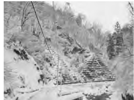
枯れ木の落下が気になるキケンな県道

類似各施設とも年々減少傾向にあります。NPO法人「お山の森の木の学校」（森林科学館）は県内でその活動が広く認知されており、これらの活動を支援しながら入り込みを増やしたい。また、新潟大学のボランティア活動や第四銀行が指導する観光活性化の関係、新潟地域振興局が主導する活性化検討懇談会等と連携して対応を考えたい。道路については県民の森へ通じる県道でもあり、危険回避を念頭に道路管理を要望していく。