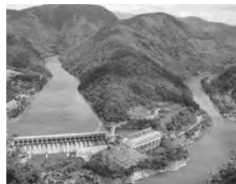
一望できる角神風景

ご指摘のあるように、私も焦りを感じるほど思っています。4町村合併しその魅力を格段に増加させて発信させていかなければならないと思ひ、いっぺいでありませ。当町として、観光産業と各種産業の融合による魅力ある観光づくりを目指して新潟県と協働し当町の魅力を多くのの人に知ってもらうため、インターネット等で利用し観光情報を提供してまいります。やはり特産品を開発していく、これらを知ってもらうことが大きな要因になるかと思ひます。国体まで、そういう物ができると思ひます。県との活性化懇談会の中で阿賀の歴史、文化というものを多くの人に知ってもらおうような力強い支援