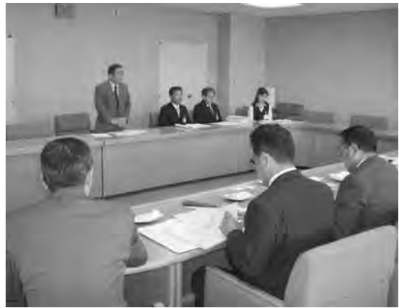
視察地での研修風景