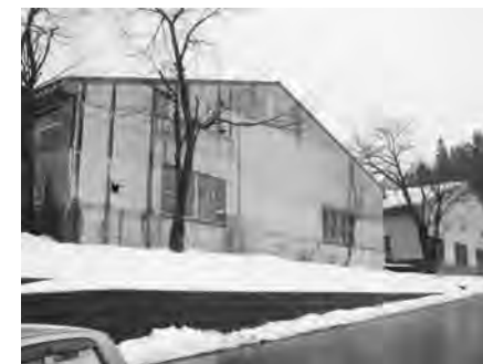
もっと企業誘致を...

町長 我が町はこの度の構造的な 況以前から他地域との差は広 がる一方で、当町の一人当り の収入は県内ワースト1の非 常に不名誉な位置にあります。 マスコミでは毎日のように経 済対策の報道がなされ、国、 県においても、いろいろの対 策を掲げ、公共事業の前倒し 発注や中小企業への販路拡大 支援策を行なうということだ ですが、町として現在の状況を どのようにしてとらえておら れるのか。また、どう対応す るのかお伺い致します。阿賀 町になつてから、商品券の発 行等で一応の成果はでていま すが、さらなる町活性化策に ついての対応を求めるもので す。 町長 深刻な事態については私も 十分認識しているところです が、国も対策を進めているわ けでもありますので、それら を待つて対応していくという 町長 建設業界の関係につきまし ても緊急的な工事や維持管理 等を早い時期での発注に心掛 けながら景気対策の一助にな るよう努力していきたいと思 っています。 町長 町で誘致した企業を含め経 営環境が非常に厳しく、もの 町長 緊急性融資の制度は実に多く の業種が追加され対応される ことになり、今現在698業種が セーフティネットの対象であ り町の認証を受けながら、金 融機関と連携して取り組んで いるということまで理解いた きたい。 町長 常々お話しいただいている ので極力そのように努めてい きたい。商店街の振興につ きましては常々商工会の皆さん 方とお会いするたびごとに活 性化策について申し上げてお り質問の意あるところを十分 念頭に置きながら努めてまい りたいと思っております。