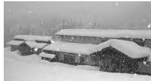
冬期間休業中の七福荘