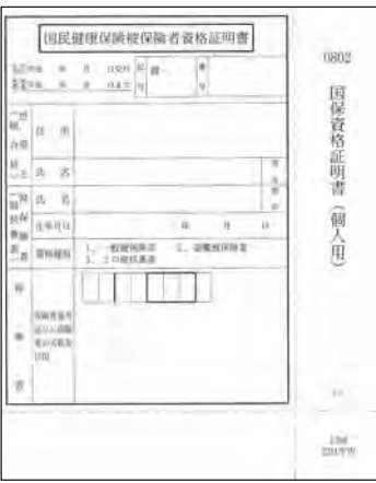
国保資格証明書(個人用)

現在、完納してない世帯が95世帯、金額にして千三百万円程です。納税相談を細かにおこない、やむを得ない場合のみ、資格証明等に切り替えたい。