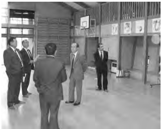
学童保育場のやまびこ楽園(学校跡地)

各保育所では、月2回の運営会議を行ない、いろんな面での改善、改良を検討し、市全体では年一回の会議を開催し、全保育所の均等化を話し合っているとのこと。