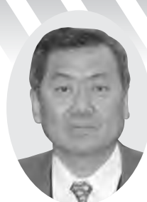
五十嵐 隆 朗 議員