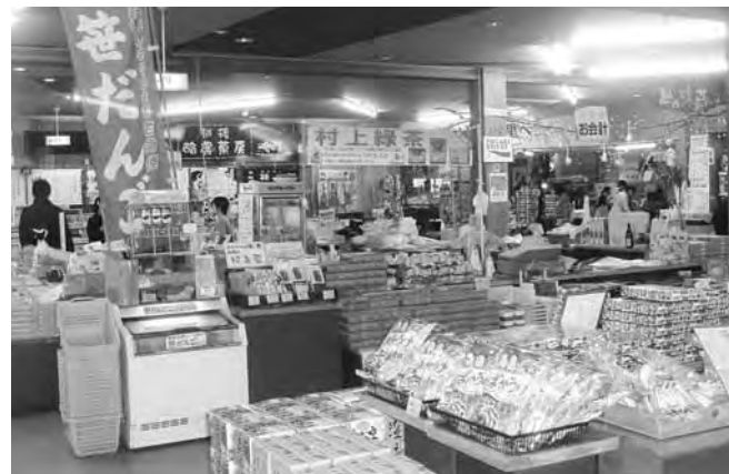
効率的な経営改革を...