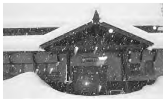
福祉事業はみかぐら荘で

【町民生活課長】 社会福祉協議会に委託している事業ですが、実施については事前に協議し、利用者の方々は、温泉施設を希望されており、上川温泉と協議の結果、みかぐら荘で対応していただくことになりました。中広間あたりを確保していただき、ゆっくり温泉に入つて、食事をとつて、簡単なハビリ活動等もできるということですのでご理解頂いてい