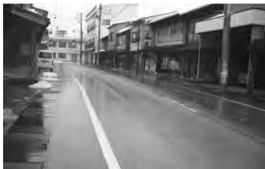
津川町内の商店街風景

す。しかし各商工会の経営指導員の指導助言を受けることも図るべきです。中小企業診断士導入に対する幾分なりの助成は、惜しむべきではないと思っております。一つ課題とさせて下さい。