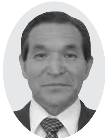
渡部 英夫 議員

類似各施設とも年々減少傾向にあります。NPO法人「お山の森の木の学校」（森林科学館）は県内でその活動が広く認知されており、これらの活動を支援しながら入り込みを増やしたい。また、新潟大学のボランティア活動や第四銀行が指導する観光活性化の関係、新潟地域振興局が主導する活性化検討懇談会等と連携して対応を考えたい。道路については県民の森へ通じる県道でもあり、危険回避を念頭に道路管理を要望していく。