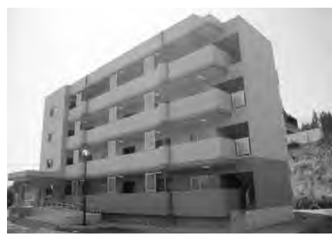
後地団地の結露対策は…

【質問】 昨年新築された後地住宅の一部に玄関から部屋全体にかけて結露で困っている入居者がおられます。その実態と原因についておたずねします。