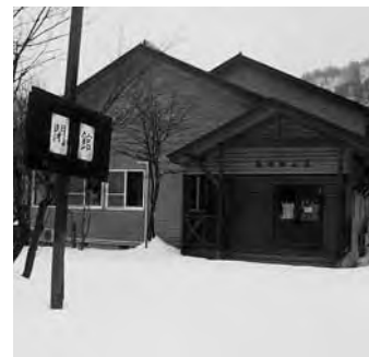
現在空き家の亀田郷山荘、もったいない

所有者の承諾も必要である。再度現地の確認を行って、県の治山担当部署と検討させて頂く。