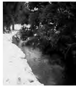
前田川下流の現況

水路の堆積土砂は阿賀野川の洪水時に逆流してきた水によるものが多いと思われる。農家組合長、地域の皆さんと現場担当が現況をみながら協議の上対応を検討していくことにする。