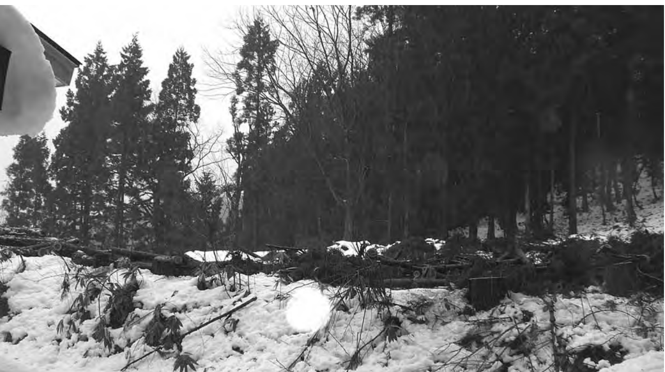
伐採中の斎場予定地

新斎場火葬炉は2基あり、より慎重に対応し時間をかけさせていただきやむを得ず繰越さざるを得ません。その辺はご理解賜りたいと思います。