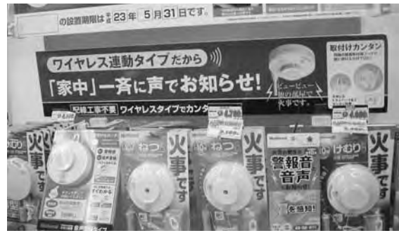
いろいろある火災警報器

東京都は全国に先駆け、平成16年10月より住宅用火災警報器の設置が義務化されました。町の条例には、住宅用防災機器、その他の物品、機械器具、及び設備の普及促進、となつてますが、火災警報器に関し、今ひとつ積極的に取り組んでいる姿勢が見受けられません。町の条例には、火災警報器の設置期限が明確にうたわれておりません。