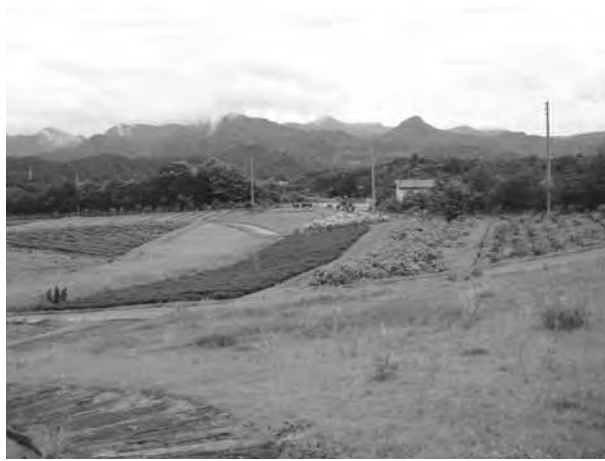
下界を見おろす、最高の候補地

【質問】 建設場所については、私も当初、現在の位置が一番手っ取り早いのかと考えていたのですが、最