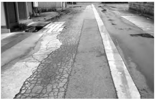
またれる道路整備