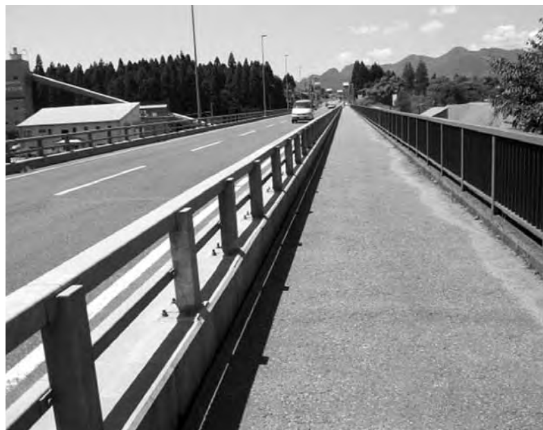
冬は厳しいだろうな

みずから体験することもあります。期間限定で運行することも考えられますので、交通体系を考える中で、今後教育委員会、学校、保護者等、関係者による協議を進めより良い方向を見出していきたい。 いるところが多く、古い住宅には建べい率が守られていない建物も多い。定年を迎えてUターンしたい人、定年にはならないが、親と同居を考えているのに、屋敷に駐車場のスペースがないので、近くに町営の駐車場を望んでいる人がいます。一方過疎化が進み空き家がふえている。これからの町づくり、都市計画にも通じるものがあります。行政