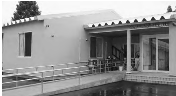
老後をすこやかに（グループホーム清川）

② 指名審査委員会は、7名制からなる2会制とし、審査額は1千萬元以上から5百萬元以上に引き下げた。 入札監視委員会は原則とし