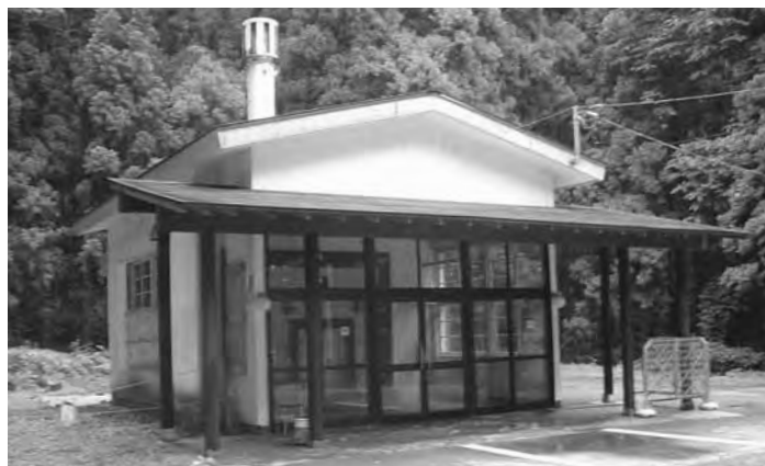
ここがつの場所とは…

【町長】 斎場については、老朽化も甚しく、本当に喫緊の課題で何をおいてもやらなければならぬ問題です。しかし反面では迷惑施設とも言えますので慎重にことを進める必要があります。 何といっても建設位置、施設規模が問題なので、やはり斎場建設設計の専門業者に委