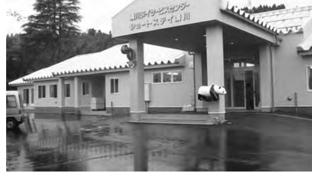
開所が待たれる新施設

町長 実は可能か伺います。 高齢化が極めて早い速度で進み、認知症もふえていく。その速度に追いついていないのが実態です。本制度改正され、介護予防、自立支援の強化にシフトしています。認知症の推定人数は全体の調査は済んでおらず把握していません。相談窓口の設置は地域包括支援センター等々、窓口で相談業務を行っており、介護実態調査は、要介護認定申請、調査員が自宅訪問し、調査票を作成します。こ