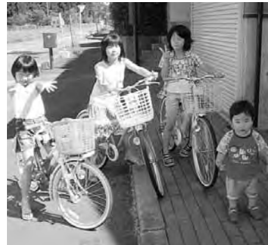
みらいある子供たち

この問題は我が町だけではなく過疎地域特有の全国的な問題であろうと思う。難しい問題である事は十分理解している。この件に関して二つお願いしたい。一つは子育て支援や若者の働く場の確保など歯止になる対策を強力に推進してほしい。もう一つは子供