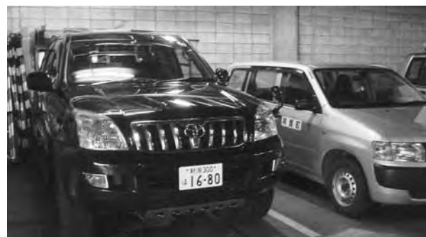
ディーラーオプション車

質問 今年度に入り、公用車を10数台購入しましたが、グレード、オプションなどが、公用車としてふさわしくない仕様があると思える。「CD、MDチューナー」、夏タイヤ、冬タイヤそれぞれにアルミホイールを装着。中にはディスプレイヘッドランプをオプションで装備。公用車の選定基準はどうなっているのか。