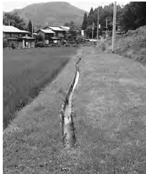
つぶれた道路に押し出されてうねっている水路

ボックスカルバート（堤防下を通っているコンクリート製トンネル）と水路に湛水することは、阿賀野川と前田川の高低差が少ないことから、十分認識している。改修については、河川管理者の県に強く要望する。出水時の冠水対策は、もう少し検討させてほしい。