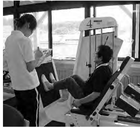
常設の筋力トレーニングマシン

現在町には津川地区に「やまぶきの里」三川地区に「高齢者支援ハウス」に筋力トレーニングマシンが常設されていますが、運動指導員の不足から回数、対象者の限定など有効利用されていない状況でもっと積極的に、多くの住民が利用できればと常々考えています。トレーニング指導には、健康運動指導士・健康運動実践指導者やスポーツインストラクターが必要ですが、人員を増やし常時マシンが使用できれば、平日の夜間や土日等運動不足になりがちな若年層中年層も対象にでき今、話題のメタボリックシンドローム予防にもつながり、より有効的に利用でき