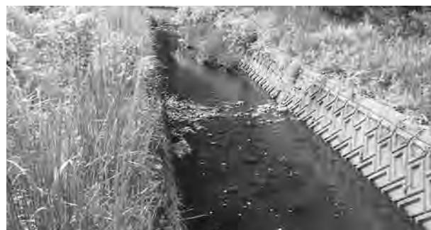
土砂に埋まる前田川河口

の土砂、岩石をその都度除去してほしい。それと、堤防の出口から、ストリートに大川に流入するように河川を改修し