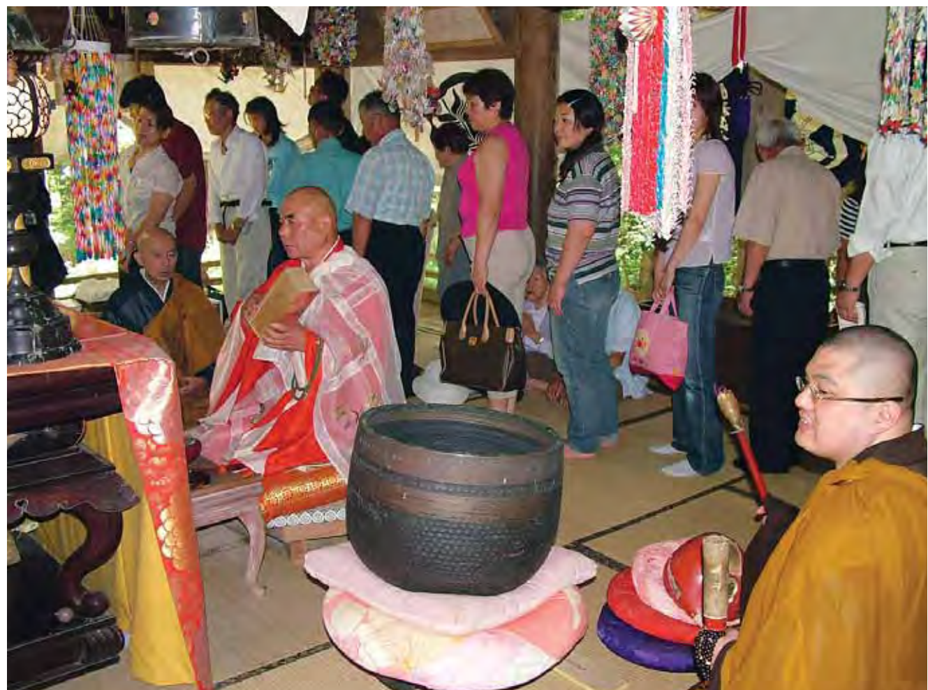
全海上人御開帳 (豊実地区菱潟)