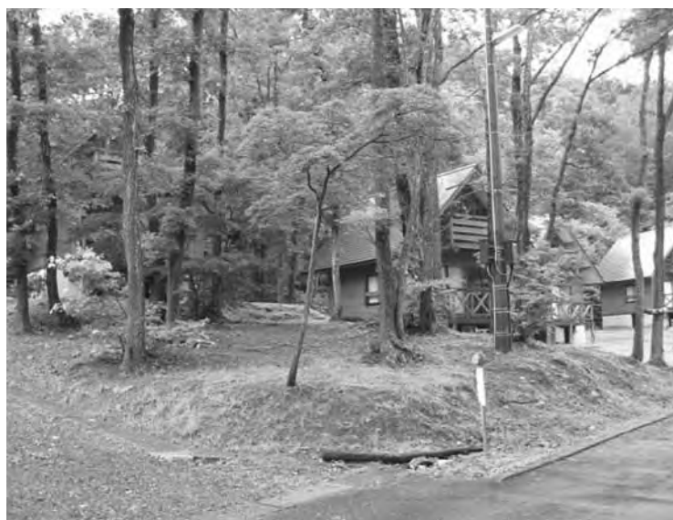
青少年旅行村（鹿瀬地内）

林、観光であります。とりわけ農業は稲作中心であり魚沼のコシヒカリに負けずすばらしい食米であります。今後も継続できるような施策展開をしなから取り組み林業も同様に重要な課題であります。観光については、温泉、スキー場、ゴルフ場、船下り、観光施設も多く整備されたのかな里山の景観であります。人情あふれる町民が大きな資源であると思います。