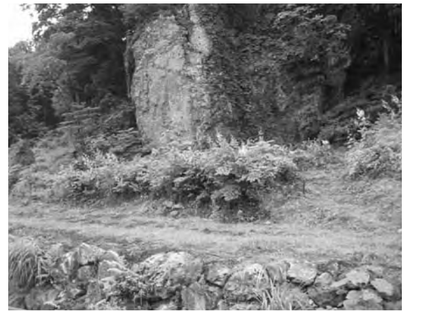
“大岩”がすばらしい…（麒麟山温泉周辺）

入札の対応に議論白熱 概要 議会最終日、6月18日に実施された町道蟬ヶ平線改良工事の指名競争入札をめぐる町の対応に議論が白熱した。 疑問点 ◇落札した特定共同企業体の構成会社2社の営業所が同一住所であること。 主張点 Q JVの2社は関連企業ではないのか。企業体として適切か？ Q 最終日の申請書提出で適正な審査が本日にできるのか？ Q 特定企業の優遇処置ではないのか？ 町当局 A 関連企業がJVを組むことの禁止規定は無い。 A 各申請書類で県の許可が必要なのはその許可を得ており、法令上問題ない。 採決 同議案は起立採決となり、反対8人、賛成13人で可決。