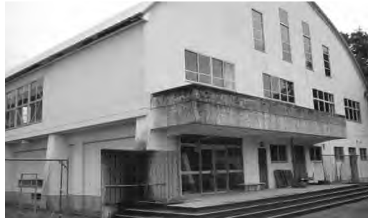
解体される津川中体育館

19年度の不登校の現状と対策について、若干名町内におり、保護者・学校・地域全体で協力連携し、きめ細かな指導体制をとり解決に向け努力しているとの報告がありました。