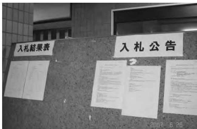
入札結果発表掲示板

また、業務委託において、常識では考えがたい予定価格の19・7%という入札結果も出ており、正当な積算に対して想定外であるとしても、公正な競争を阻害し、業務履行の質の低下も懸念され、その設計成果品に基づき施工される工事に悪影響を及ぼす危険さえあります。記憶に新しい建築の設計強度不足に伴う社会問題も発生しております。 低価格入札は実に多くの問題をばらばらしており、町発注工事並びに業務委託について最低制限価格制度を導入して頂きたいと存じます。