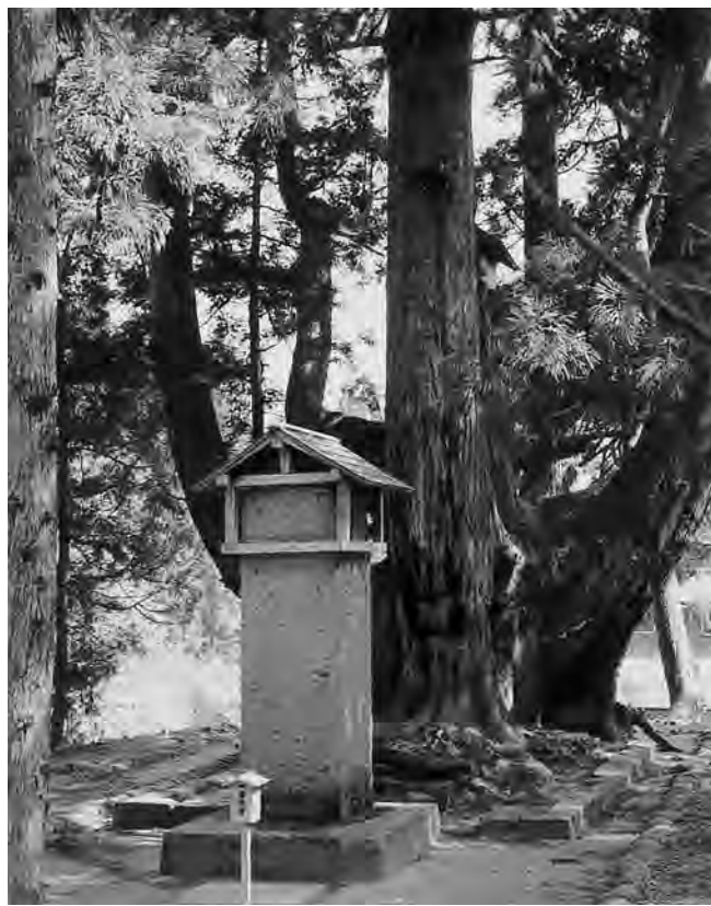
日本一の将軍杉と碑銘

余五将軍の終焉の地、岩谷にはその名にちなんで名付けられた日本一の杉の巨木「将軍杉」が聳えている。千四百年の時を経て、その歴史の生き証人はただただ無言である。