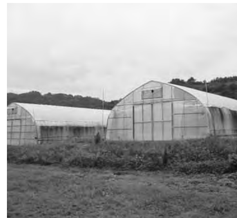
角神いちご栽培施設