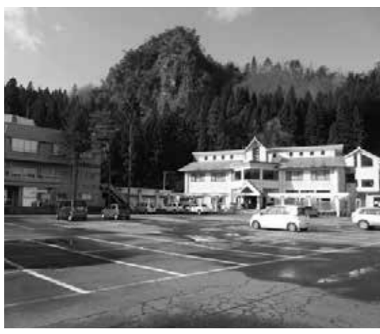
売却される㈱ホテルみかわ

●(株)ホテルみかわの株式譲渡 町所有株の全て(株)ホテルみかわに (株)ホテルみかわの株券1,800株を町が全て所有していた。これを10,000円で(株)ホテルみかわに譲渡する議案が町から提案された。 (株)ホテルみかわは、赤字続きで債務超過の会社である。今後はこの会社を中国資本の日本山嶼海(株)が買収し、自社の関連会社社員の保養所と中国富裕層の長期滞在型のホテルにする意向。 中国資本の参入については、多くの議員から疑問の発言があった。賛否の結果無記名投票により8対6で可決となった。