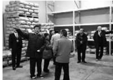
雪室を活用した農業振興（七ヶ宿町）

商品として エゴマドレッシング、エゴマ油、エゴマ菓子パン等を製造販売し、農業の活性化を図り収益を上げている。 まとめ 山間寒冷地であり当町と類似した環境であるが、農業の取り組みと販売方法が充実している。雪を利用した雪室品として付加価値を付け、ブランド米として販売しており学ぶ所が大である。エゴマ栽培については、近年健康食として6次産業の期待が出来る。しかし機械化されておらず、高齢者の栽培には限界があり課題として残る。又耕作放棄地対策として実施出来るか、高齢化が進む当町において、いかにして農業の振興を図るかが大きな課題と考える。