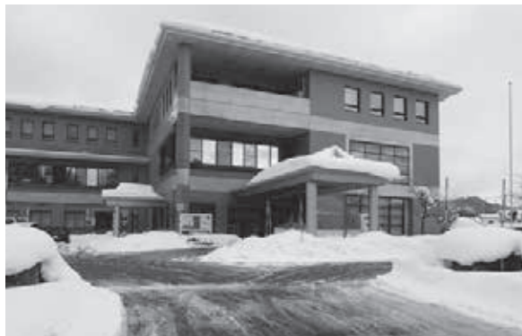
初冠雪の阿賀町庁舎

○議会費 ○議員報酬 12年の間に1回しか見直しがなく、阿賀町特別職報酬等審議会の答申を受け、10%の報酬引上げを審議、討論に持ち込まれ、賛成多数で可決。