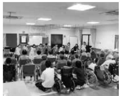
サービスの低下のないように

町長 地域生活支援事業の拡充と現行の要支援者のサービス後退がないような取り組みをしていただきたい。