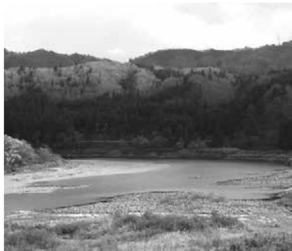
堆積砂利の処理はどうなる(楊川ダム下流谷沢地区)