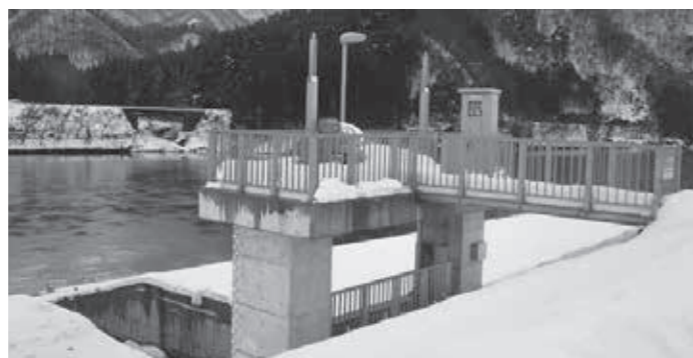
築堤の樋門（石間地区）

定例会議が、平成28年12月13日から12月16日までの4日の日程で開催。議会の諸報告、町長の行政報告、8名の議員による一般質問、2件の承認案件、条例改正などの議案15件、平成28年度12月一般会計補正予算・特別会計補正予算9議案の案件を審議、原案どおり承認、可決した。