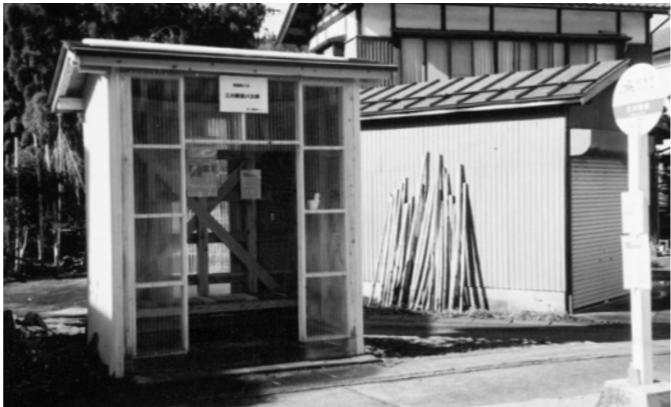
設置なった待合所(三川駅前)

町長 ご指摘いただいた待合所のないバス停が町内で3カ所あります。高速バスは試験運行中ですが、冬期間を迎えるに当り、利用者