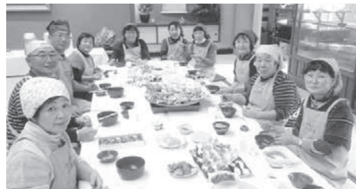
郷土料理を囲んで（上川会館）

あったかな?このパン好きなんだわ」と買いに来てくれると嬉しくなります。 お会計を済ませ、私の知らない町の話や自分の畑の話、ご家族やご自身のお話を笑顔で話してくれるのも嬉しいです。物を売り買いするだけでなく、ここでの出会い、会話のやりとりや笑顔で阿賀町の良さや人柄の良さを実感することができ、とても気持ちがあ