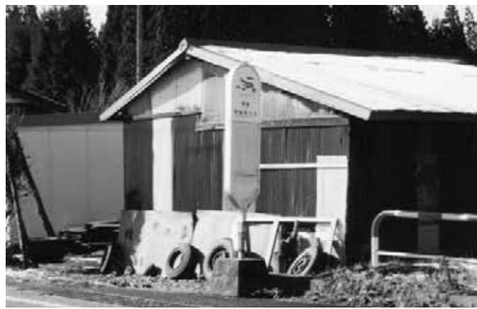
待合所の設置が待たれる両郷地区