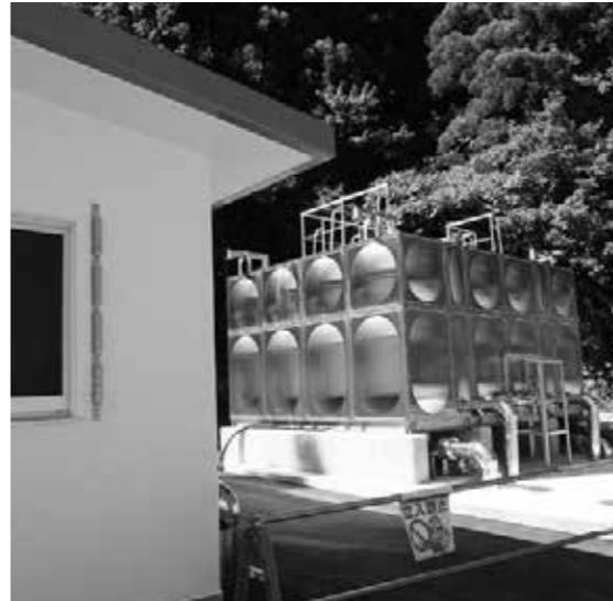
新設された水道施設 (中ノ沢)