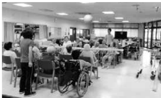
施設のデイサービスの利用者

町長 現行より低い介護報酬を設定した。基準を緩和した中で利用者の選択肢がふえていく。町内の事業者には説明をした。具体的には、事業費の枠を見ながら、町と効果的な事業の構築を考えていく。