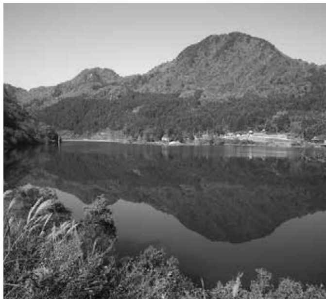
大牧・赤岩に橋を架けては