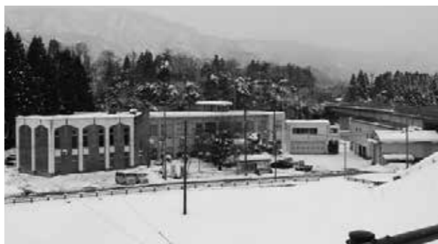
交付税の対象になる支所（三川支所）