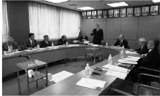
白馬高校での研修

統合論議はしない、丁寧な説明を出向いて、議論を尽くすことを提言する。 白馬村と小谷村は、観光産業が主体の地域特色を生かし白馬高校の魅力化を図り、県教育委員会の理解のもと高校存続のため国際観光学科を設置した。 阿賀黎明高校存続に向けては、高校の現状等を公開し町民に理解される必要を感じた。