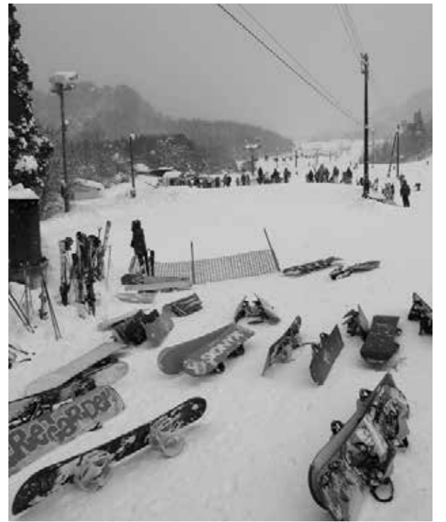
待望の降雪でにぎわうスキー場

各地区で一般会議や意見交換会を行い阿賀町教育の充実を図っていく行動をすることにした。