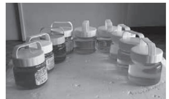
阿賀町産のエゴマ油

質問 エゴマ作りの支援員として応募で採用され、六次化を目指して頑張ってきたが職場との意見の違いから辞めることになった。彼らのエゴマの報告書を見たら立派なものであった。なにがあったのか伺う。 町長 詳細に記録された報告書であったと聞いています。職員との対応に行き違いがあったようですが、それだけが辞職の理由ではないようだ。