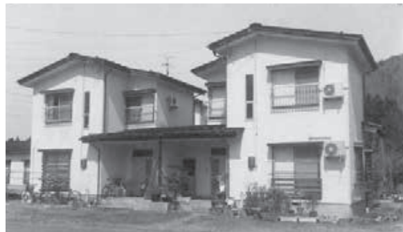
堂島町営住宅の売却を