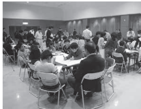
未来の夢を考えるこどもたち

町長 私ほど開いている町長室はないかと自負している。職員はじめていつでも町長室に来てほしい。町民にもいつでも来庁を望みます。今後は自覚して解放感を示していく。