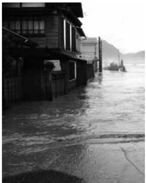
新潟・福島豪雨災害での冠水状況

質問 町は、町内各区分長に自主防災組織の組織化を文書だけで、通知しているがもっと丁寧な説明が必要ではないか。