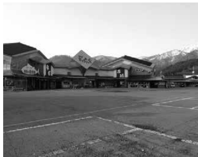
第三セクター抜本的改革は…

誘客等の成果を十分図ることとは難しいと考える。各事業所の連携をより密にして取り組んで行くことが大事だ。 町長 二社ある農業公社については昨年度から継続している県の6次産業化プランナー事業から専門家の指導を受け改善を図る。将来的には両公社の一本化も視野に入れていく。