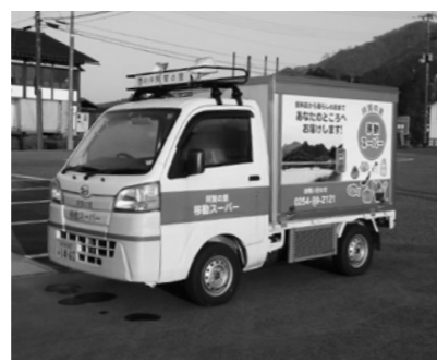
期待が大きい移動販売車

質問 町長の答弁を聞いて多くの疑問がある。第三セクターにはリーダーがいないう。海を航行して自分が寄港するところが知らない難破船のようだ。 町長 リーダーは企業の目標を決め、従業員に夢を与え、働く意義を生み出し、士気を高めるといふ大切な人材育成が必要と思うが。 町長 地域の連携を密にし、地域の産業、観光施設を活用しなければならぬ。まさに人の問題と考える。