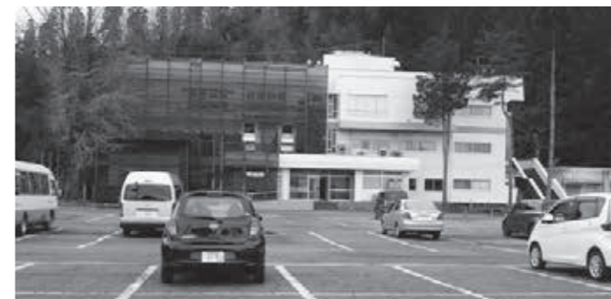
改築中のホテル三川

質問 昨年ホテルみかわを中国の山嶼海という会社に売却した。今後インバウンドへの対応が急がれるが所見を伺う。 町長 住民が頻繁に使うプールから改修に入り、宿泊施設等から順次整備することになっている。 地元の酒、米、農産物を使った料理等で住民の皆さんから協力を頂きたい。