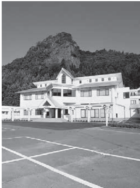
売却したホテルみかわ

歳入歳出の減額要因としては、民生費は国民健康保険特別会計操出金等が給付実績が予定より少なかったため、林道開設事業費は事業費確定のためである。 また、商工費は「ホテルみかわ」の株式売却によって、改修を予定していた工事費が不要となったことによるものです。 予定した事業で未了で次年度に繰り越す事業は下記のとおりです。