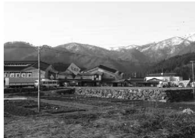
経営方針を明確にせよ (阿賀の里全景)

質問 統合しなければできない問題かどうか問題であると思う。 町長 統合しなくても、皆さん