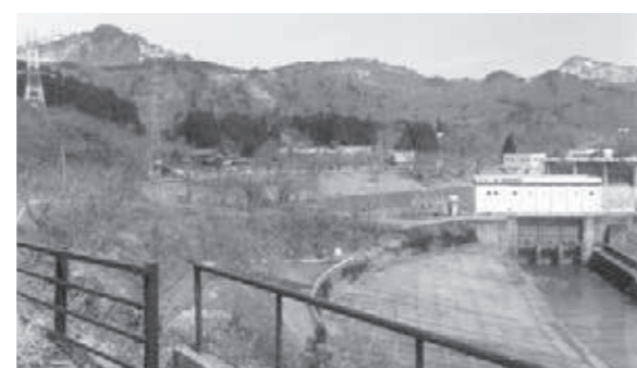
観光にもっと力を...

である。今、町の観光は衰退している。一口に言っていてに刺激が足りない。このようなことでは、観光が成り立つ訳がない。特に観光協会は一般社団法人になったので頑張ってもらいたいものである。 刺激のないところに希望など生まれない。又、どのような組織でも女性の声が届かないところは衰退する。観光について女性の声も聞いてみてはいかがか伺う。