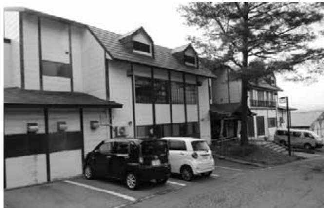
統合予定の奥阿賀観光

質問 平成20年度の売上げが、6億6500万円あった。平成28年度は、2億9000万円となる見込みとのこと。 町長 時代に即した企業価値の創造、顧客の創造ができていない。従って、売上げも落ち込み、毎年利益もでない。