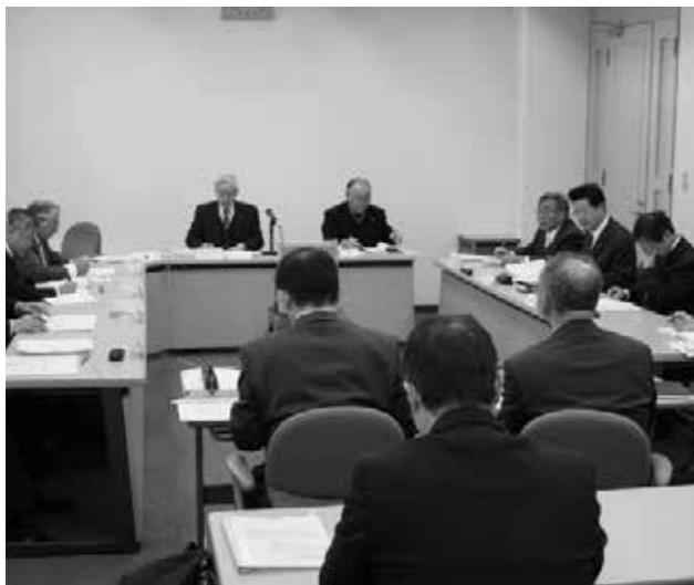
統廃合問題を審議中