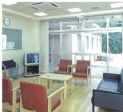
談 話 室