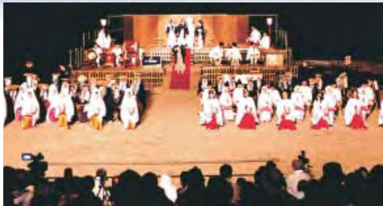
*古紙配合率100%の再生紙を使用しています。