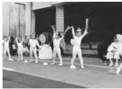
花嫁を祝う子狐の踊り