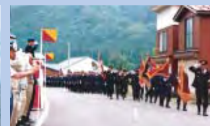
威風堂々の分列行進(鹿瀬方面隊)