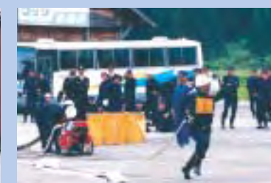
小型ポンプ操法(三川方面隊)