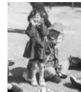
狐の顔で「ハイポーズ！」

最後に、皆さんから多大なる御協力を賜り、第16回「つがわ狐の嫁入り行列」は過去最多のお客様からおいでいただき、大成功となりましたことに御礼申し上げます。大変ありがとうございました。