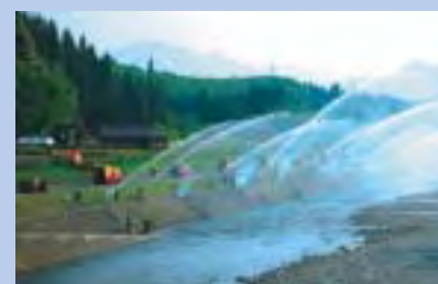
一斉放水(上川方面隊)

5月22日から6月12日までの毎週日曜日に阿賀町消防団各方面隊の消防演習が開催されました。五月晴れと呼ぶにふさわしい快晴となった5月29日(日)には、上川地区の向ノ島公園にて上川方面隊の消防演習が行われました。演習は7時になると同時に、消防のサイレンが高らかに鳴り響き、消防団の一斉放水が始まりました。消防団の勇姿を一目見ようと朝早くから集まる付近の住民たちが見守る中、いくつもの放水によるアーチが常浪川にかけられました。人員姿勢服装、機械器具の点検が終わり、小型ポンプ操法競技が始まると、各選手たちは練習の成果を発揮して獅子奮迅の勢いで競技に臨むと、観衆からは大きな拍手が沸き起こりました。上川幼年防火クラブの微笑ましい踊りで締め括られた今回の演習では、消防団員のきびきびとした行動がとても頼もしく見え、防火・防災活動への重要性が再認識されました。皆さんも家庭や職場、また山仕事等での火の取り扱いには十分注意し、阿賀町を火災のない住みよい町にしましょう。