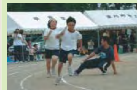
三郷小学校運動会

途中の急な雨により、一部競技が後日に延期となりましたが、子供たちの楽しそうな表情がとても印象的な一日となりました。