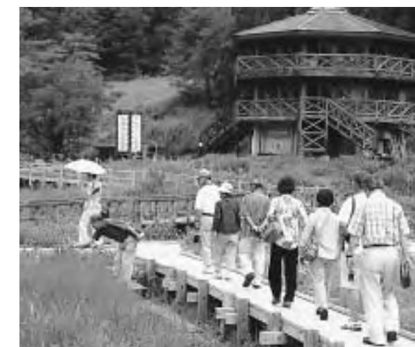
たきがしら湿原(上川)

ツアーは、上川のたきがしら湿原、鹿瀬の赤湯、奥阿賀ふるさと館、遊覧船、津川の狐の嫁入り屋敷を訪れました。参加者は各施設のガイドさんの説明を熱心に聞いたり、写真を撮ったりしながら、「こんなところがあったのか。新しい発見ができました。こういったツアーを今度は町民を交えて一緒にできたらいいな。」と話していました。