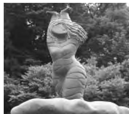
寄贈されたモニュメント「明けの詩」