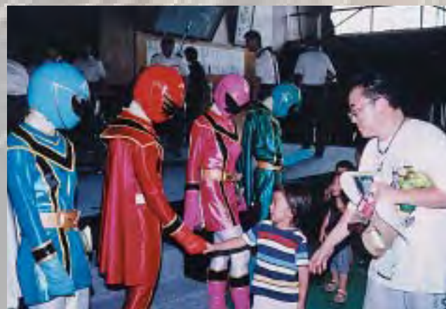
マジレンジャーとの握手会には長蛇の列が