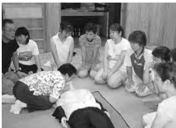
人工呼吸などの救命講習を受ける参加者