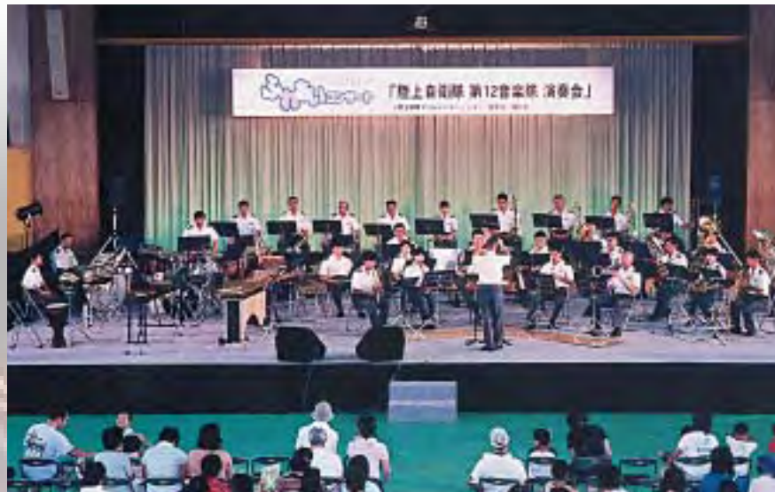
素晴らしい演奏を披露する陸上自衛隊第12音楽隊

夏まつりの定番である花火大会は3会場それぞれに仕掛け花火やスターメインなど約400発が打ち上げられ、来場者は間近で見る花火の迫りに盛んな拍手と歓声をおくっていました。