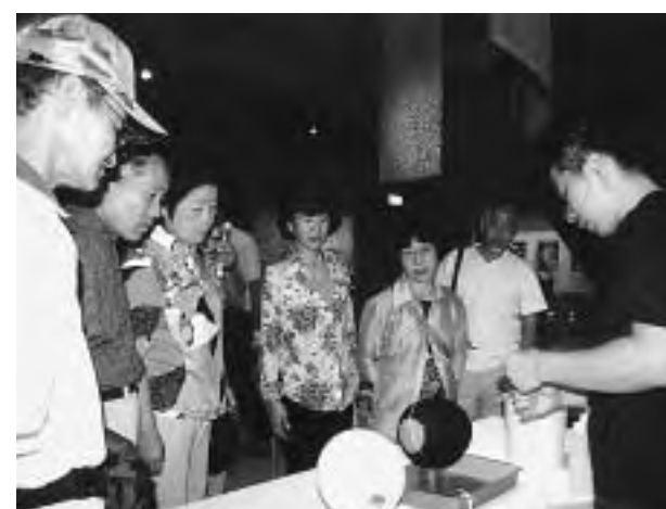
奥阿賀ふるさと館(鹿瀬)