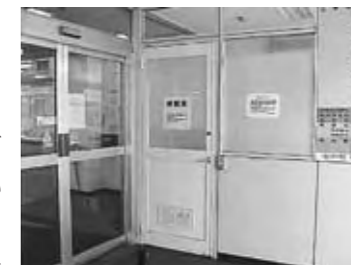
こちらが指導室です

津川病院薬局では、薬を正しく安心して使っていただくために、薬の使用法の説明を行っています。写真は、気管支喘息などの治療に用いられる吸入薬の説明を行っているところです。このような薬剤指導を受けたいと思われる方は内科外来または薬局にてお尋ねください。