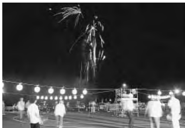
花火が打ち上げられる中、踊りを楽しむ参加者