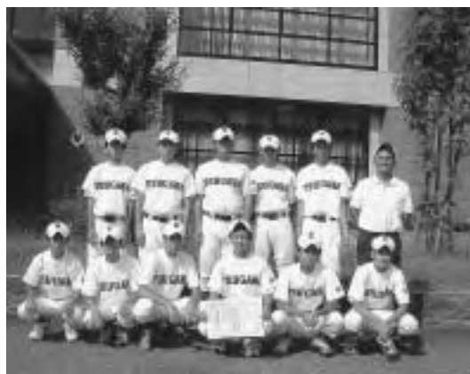
新潟県勢として唯一3位入賞を果たした津川中学校野球部のみなさん

7月30日(土)・31日(日)の2日間、阿賀野市で「磐越自動車道沿線都市交流会議 第9回親善スポーツ大会(少年野球の部)」が開催されました。