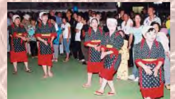
上川おけさの音頭によつての仮装盆踊り大会