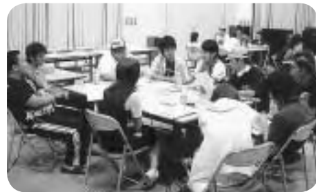
成人式の運営について検討した実行委員会の様子

今回の成人式を行うにあたり、初めに頭を悩ませたことは、阿賀町となり4地区一緒にの式典になり、今までの例がなかったということです。ですが、実行委員のみんなが考えを出し合ったおかげで、成人式当日は、すばらしい式典を行うことができました。