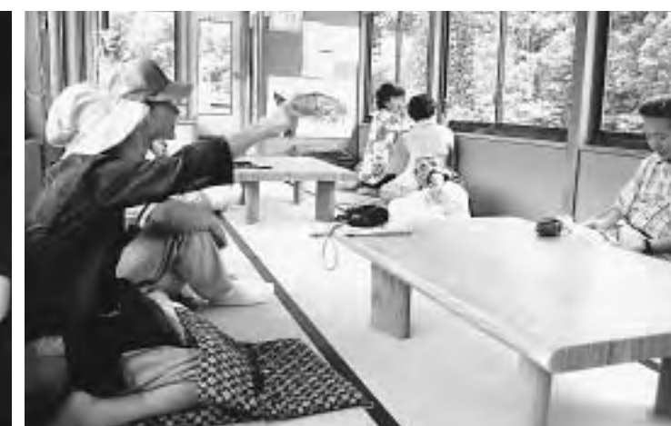
奥阿賀遊覧船(鹿瀬)