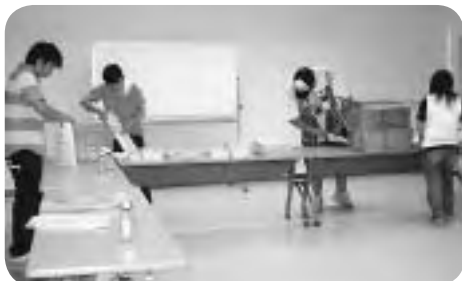
要項作成、配布物の詰め込み作業を行う実行委員

成人式に出席できなかった新成人で、まだ記念品を受け取っていない方は、阿賀町公民館及び各分館に受け取りに来て下さい。家族の方でも結構です。