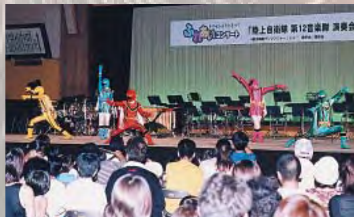
子どもたちに大人気「魔法戦隊マジレンジャー」