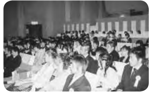
真剣な眼差しで祝辞を聞く新成人

平成17年度阿賀町成人式が8月15日に阿賀町文化福祉会館で挙行されました。今年度の対象者は昭和60年4月2日から昭和61年4月1日までの出生者で町内在住者及び町内の中学校卒業生164人、そのうち125人の参加がありました。当日は、久しぶりに顔を合わせた仲間たちとそれぞれの近況や思い出話を楽しそうに