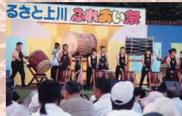
勇壮で迫力のある御神楽太鼓