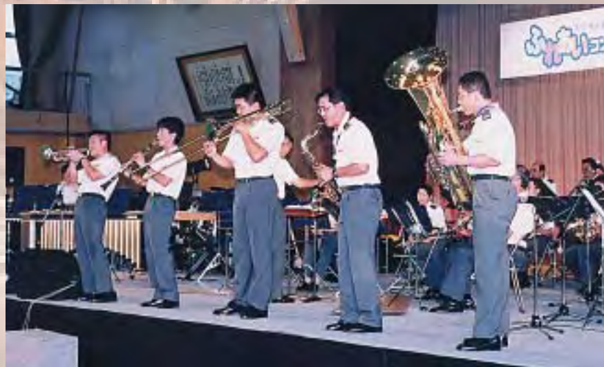
動きを入れた演奏で会場も最高潮に