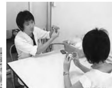
薬剤師から指導を受けている患者さん