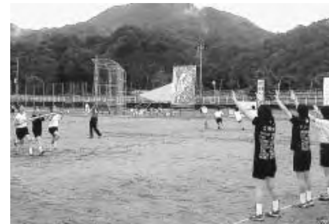
鹿瀬中学校体育祭

当日は、競技の合間に児童や生徒が発するかけ声がか会場を盛り上げ、応援にかけつけた家族や来賓、地域の皆さんからも盛んな拍手と声援を受けていました。