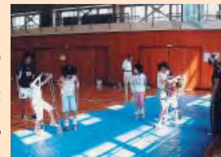
空き缶を使ったパカパカ