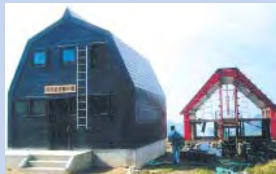
新しくなった御西小屋(左)と役目を終えた2代目

外観は褐色(こげ茶)の落ち着いた色合いで、内部も昭和52年に建設された2代目の鉄骨造から今回木造となったことで結露しにくくなっています。また飯豊連峰の優れた自然環境に配慮し、エコトイレが併設されています。