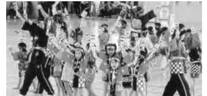
鹿瀬保育園・日出谷保育園