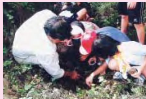
ここにいるかなあ

捕獲された約300匹は、一冬の飼育を経て新しく整備された護岸に放流される予定になっています。