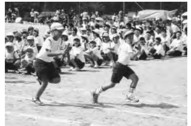
三川小・中学校大運動会