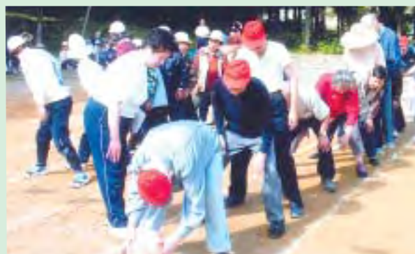
足を広げて待ちかまえるボール送り

10月6日(木) 老人ホームきりん荘健康祭が行われました。3年ぶりに屋外での開催となった健康祭は、入居者や老人クラブの皆さんがあめ玉ひろいやパン食い競争などの個人競技のほか、ボール送り、紅白玉入れといった団体競技を展開。和気あいあいとした雰囲気の中周囲からも笑い声援が送られました。また、鹿瀬保育園の子どもたちも応援に駆けつけ踊りを披露したほか、入居者との風船とりゲームに参加。透き通った秋晴れの1日を満喫していました。