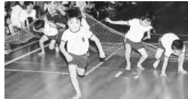
もみじ保育園・とこなみ保育園