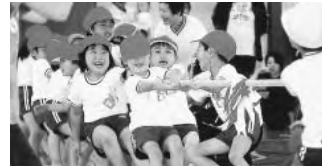
上条保育園・日野川保育園・三宝分保育園