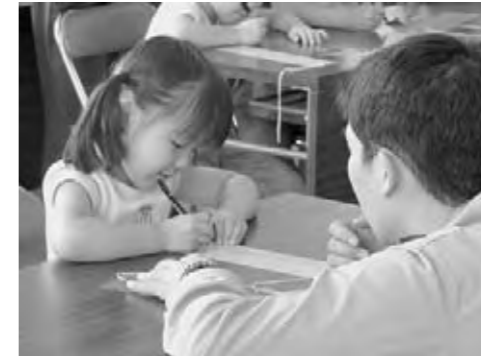
短冊に願い事を書く園児