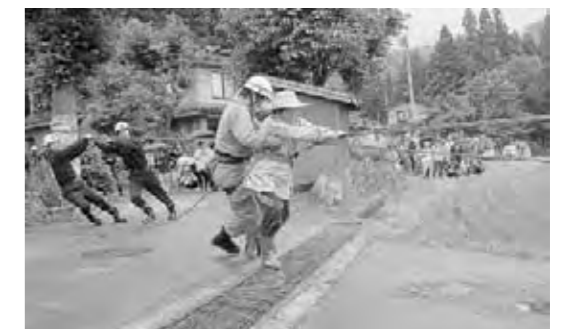
町消防署員によるロープでの救助訓練

また、6月25日（日）には、梅雨時期を迎え風水害に備えようと津川B & G海洋センターで水防訓練が行われました。方面隊ごとに4個小隊にわかれた消防団員は、縄の結び方や土のうの作り方などの指導を受けた後、汗まみれになりながら積み土