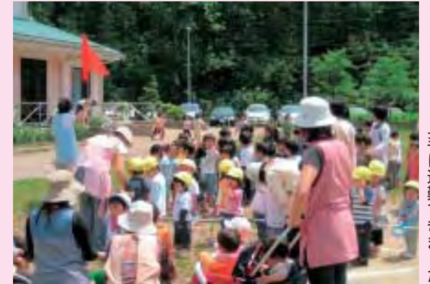
上手に避難できました

いざという時に備えて、ご家庭でも避難経路や避難場所などを子どもたちと一緒に確認する機会をつくってみてはいかがでしょうか。