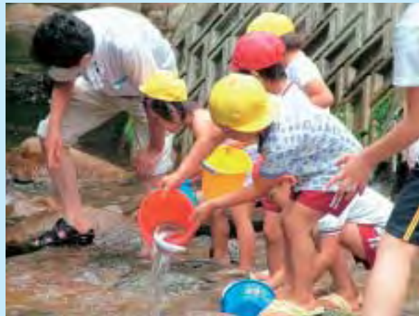
ヤマメの稚魚を放流する園児たち

鹿瀬地域の保育園児によるヤマメの放流が6月27日(火)、荒沢区内を流れる馬取川で行われました。当日は鹿瀬、日出谷保育園の園児たちがバケツに分けられた約3,000匹の稚魚を「大きくなって帰ってきてね」と小さな手でやさしく川のなかに放しました。子どもたちにとってはまだ冷たさの残る川もなんのその、水しぶきをあげながら元気よく初夏の1日を楽しみました。