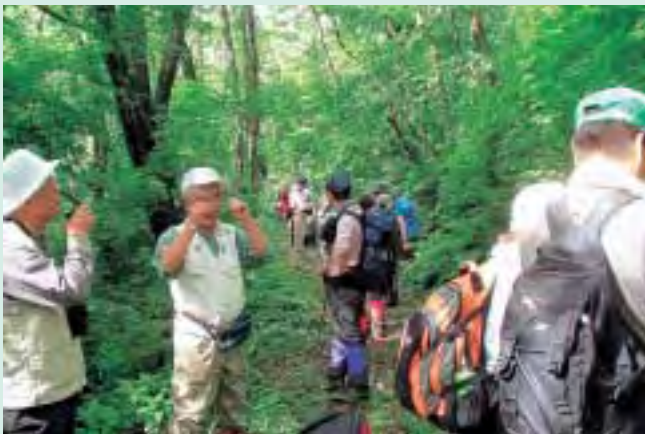
新緑のなか、ちょっとひとやすみ

6月10日(土)、日本平山登山が開催されました。午前7時に町教育文化センターに集合し、そこから登山口まで15分。ベテラン参加者は頂上まで、登山初心者も大池まで登り、新緑の木々の下、珍しい植物やカエルと黒サンショウウオの卵を観察したり、まだ残っている雪渓の上を歩いたり、地名の謂れを聞いたり貴重な体験をしました。