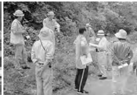
ふるさと発見教室

阿賀ふるさとカレッジ「ふるさと発見教室」(体験・見学)と、「あが歴史教室」(講義)がスタートしました。各教室5回シリーズで6月から10月まで開催しています。