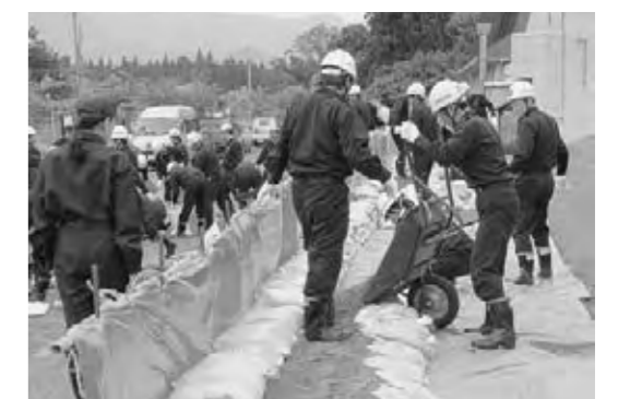
土のう積みなどの作業にあたる消防団員