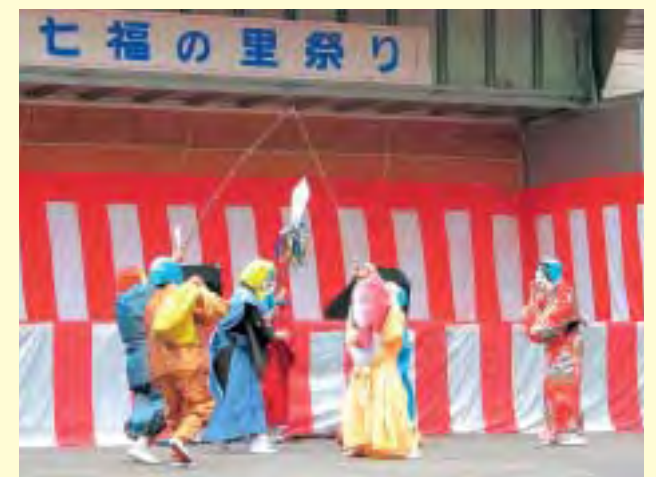
「こぶし会」の皆さんによる七福ひょっとこ踊り

当日は、地元「こぶし会」による「七福ひょっとこ踊り」や、都鼓浪会による勇壮な御神楽太鼓などのアトラクションが行われ、会場を大いに盛り上げてくれました。また、会場では蕎麦やぐしもち、山菜等の特産品も販売され、来場者は町の特産品に舌鼓をうっていました。