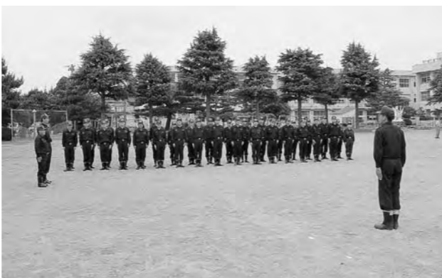
指揮者の号令が響きわたる訓練礼式