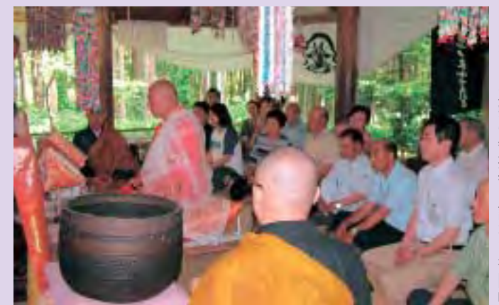
大勢の参拝者が訪れた御開帳

当日、菱潟区の集落内には「全海法師大祭」ののぼりが並び、年1回の御開帳に町内外から多くの参拝者が訪れました。参拝者は鯛口を打ち鳴らし、安置されている全海上人に手をあわせ家内安全、無病息災を祈っていました。