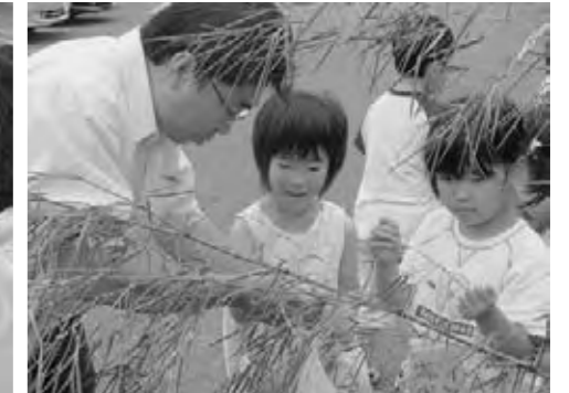
みんなで仲良く飾り付け