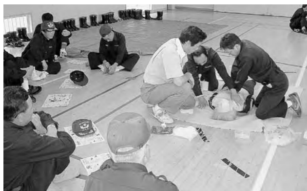
AEDによる救急講習を受ける消防団員

会場となった五泉小学校には五泉市消防団員、阿賀町消防団員あわせて200人が参加。幹部を中心とした消防団員は停止間動作や小隊横隊点検などの訓練礼式をはじめ、心肺蘇生法などの救急講習を受講しました。特に救急講習では平成16年7月から一般の使用が認められたAED（自動体外式除細動器）を用いた講習を実施。団員の皆さんは真剣な表情でAEDの取扱いについて消防署員からの指導を受けていました。