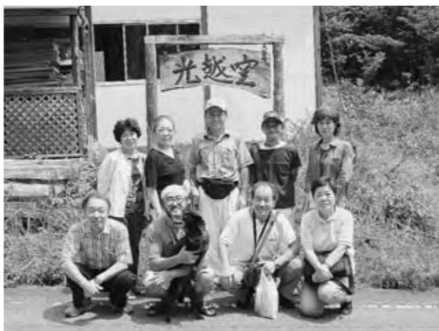
陶芸体験後に記念撮影