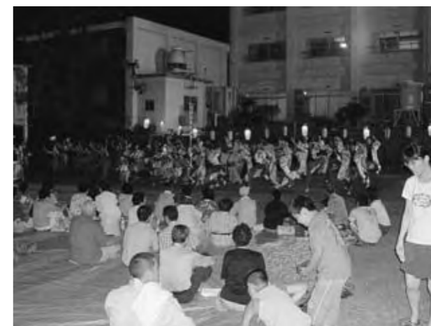
納涼会のひとコマ