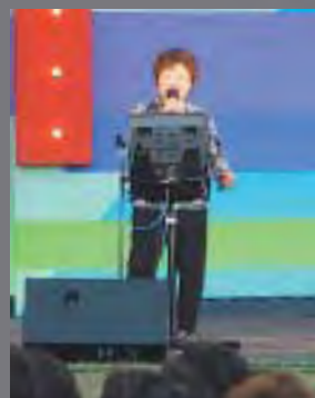
熱唱!カラオケ大会