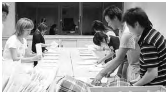
要項作成、配布物の詰め込み作業を行う実行委員