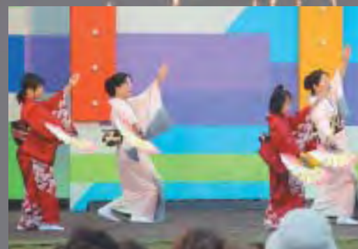
お祭りを艶やかに彩る「七名こぶし会」