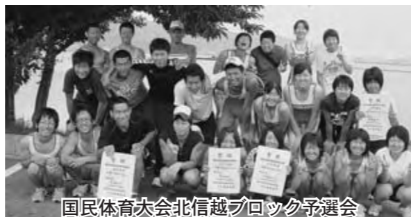
国民体育大会北信越ブロック予選会