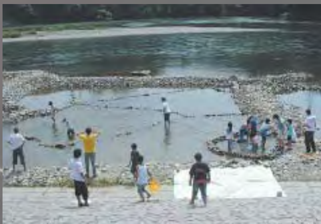
魚のつかみ捕り会場