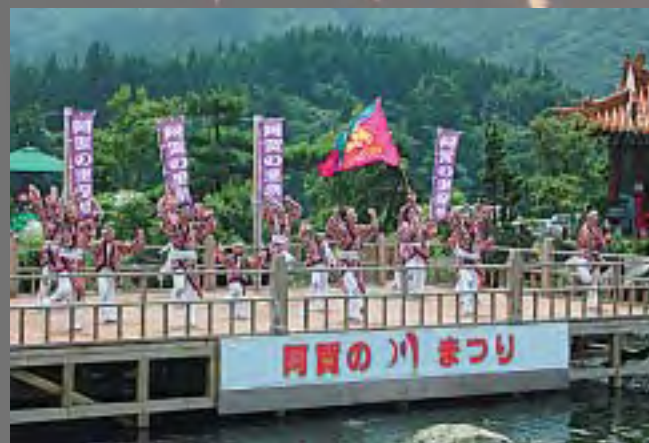
よさこいの華麗な舞い

また、9チームが集結したよさこい踊りは、それぞれのチームカラーを発揮した華麗な舞を披露し、観客の皆さんを魅了していました。