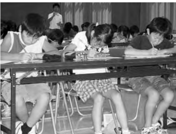
熱心に問題に取り組む小学生

途中「難しいなあ」などという声も聞こえましたが、子どもたちはあきらめることなく熱心に問題に取り組んでいました。