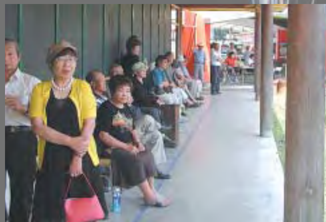
カラオケ大会に長蛇の列