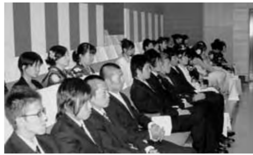
真剣な眼差しで祝辞を聞く新成人

当日は、久しぶりに顔を合わせた仲間たちとそれぞれの近況や思い出話に花を咲かせ、楽しそうに話す姿