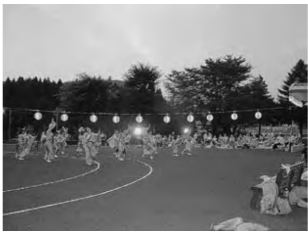
三川 Ageha の皆さんによる「よさこい」

お盆明けの8月18日(金)、老人ホームきりん荘納涼盆踊り大会が同施設の広場で盛大に行われました。恒例のアトラクションでは、鹿瀬太鼓の会による太鼓打ちや三川Agehaによる「よさこい」などが披露され、会場は大きな歓声に包まれました。引き続き行われた盆踊り大会では、入居者の皆さんをはじめ地域の皆さんが踊りの輪に参加。参加者は佐渡おけさやきりん荘音頭、鹿瀬民踊保存会の皆さんによる鹿瀬甚句などにあわせて思い思いに踊りを楽しみました。