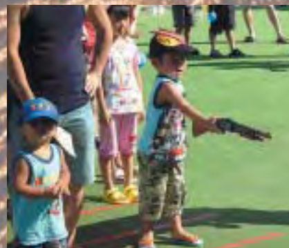
大盛況 ふれあい広場

8月16日(水)、上川地域で夏恒例の「ふるさと上川ふれあい祭り」が開催されました。