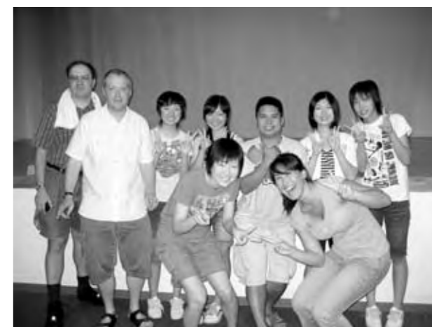
講師の先生方と一緒に

さすがに最終日の3日目となると、講師の方々と英語で会話する姿を目の当たりにし、中学生の対応力や吸収力の早さに驚かされました。