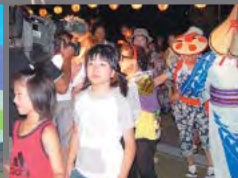
輪になり仮装盆踊り大会