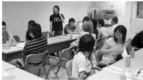
成人式の運営について検討した実行委員会の様子