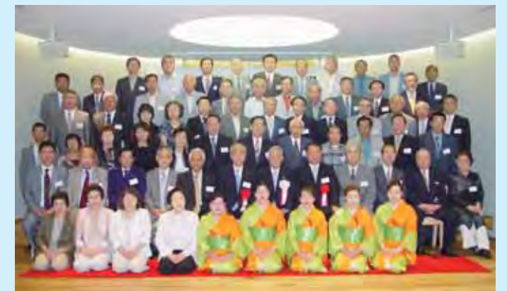
盛大に行われた東京上川会総会

記念すべき10周年の東京上川会。今年もまた上川ゆかりの方々が一堂に集まり、盛大な会となりました。参加者は、時が経つのも忘れ、ふるさとの話題に花を咲かせていました。