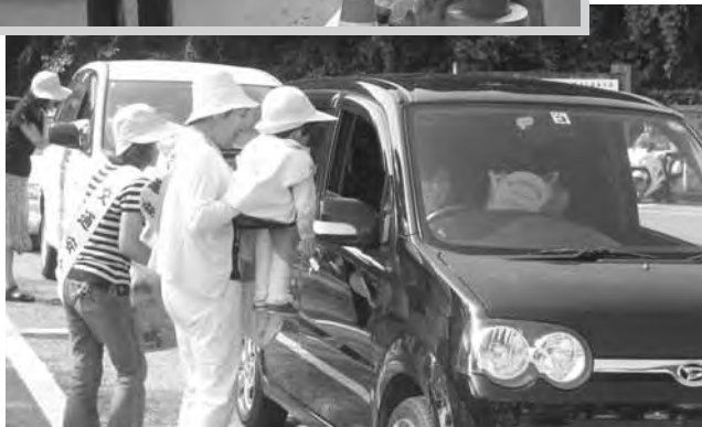
三川地域交通指導所

8月1日(水)から10日(金)までの10日間、「夏の交通事故防止運動」が実施され、期間中の6日(月)に津川・鹿瀬・上川地域で、7日(火)には三川地域でそれぞれ交通指導所が開設されました。