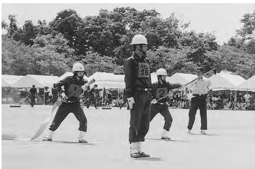
炎天下のなか操法を行う選手たち