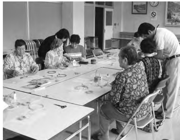
熱心に作業をする参加者

7月18日(水)、谷沢区を対象とした「紙バンド教室(出前講座)」が開催され、紙バンドで小さな小物入れづくりに挑戦しました。