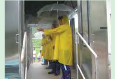
羽越水害時の降雨を体験する子どもたち

かっぱに長靴、傘を持って緊張気味に「雨ニティ号」のなかへ入った子どもたちは、雨の激しさに驚きの声をあげていました。