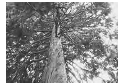
▲神々しいあすなる檜