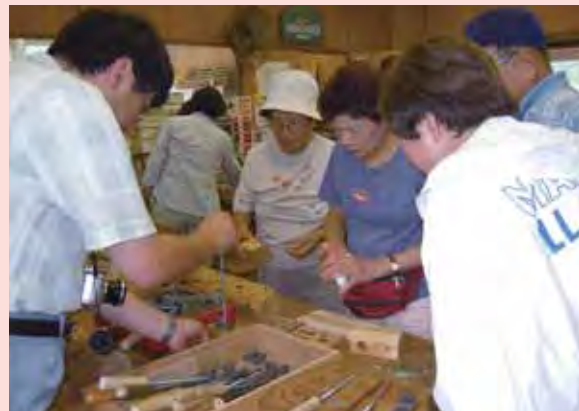
中ノ沢森林科学館でケヤキのペン立てづくりに挑戦