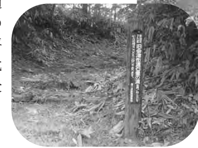
▲旧会津街道 石畳の道

分道標は、越後に通じる旧会津街道の証となるもので、平成10年に町の文化財として指定を受けています。