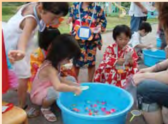
スーパーボールすくいを楽しむ子どもたち