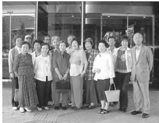
近代美術館前にて

明治から平成にかけて、新しい表現や思想を求めて、パリへ渡った黒田清輝、藤田嗣治らの洋画家たちの西洋画の伝統に日本画の感性を融合させた数々の作品を鑑賞し、参加者は個性豊かな芸術作品を堪能していました。