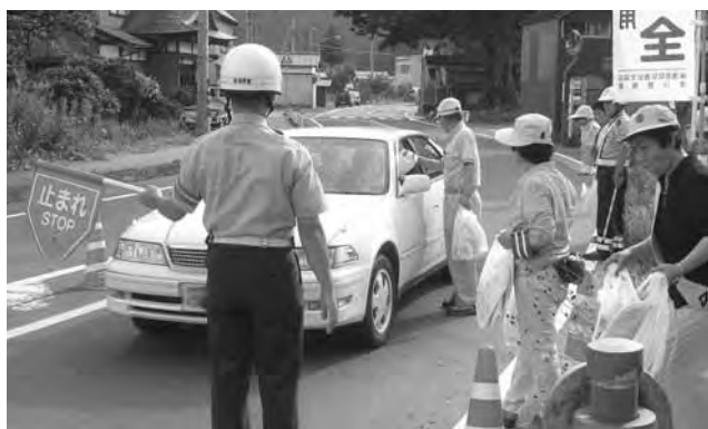
鹿瀬地域交通指導所