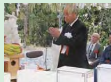
交通安全祈願をする町長

当路線の完成により、起点の西区から終点の高出区の15,399mが通行できるようになり、住民生活の利便性や産業の活性化などに大きく寄与するものと期待されます。