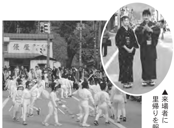
里帰りを祝う子狐たち

また、もみじ・とこなみの両保育園児による子狐の祝い踊りやお餅の振る舞いが行われ、2人の里帰りをお祝いしました。