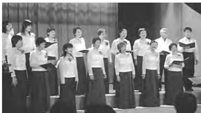
阿賀野川混声合唱団の皆さん

当日は合唱組曲「阿賀野川」など10曲を披露。また上川地域の合唱団「かじか達」の皆さんを招いて合同合唱なども行われ、会場に響きわたる美しいハーモニーに、集まった120名の観客は心地よさそうに聞き入っていました。