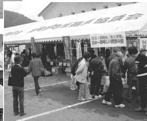
産業フェスティバルin三川