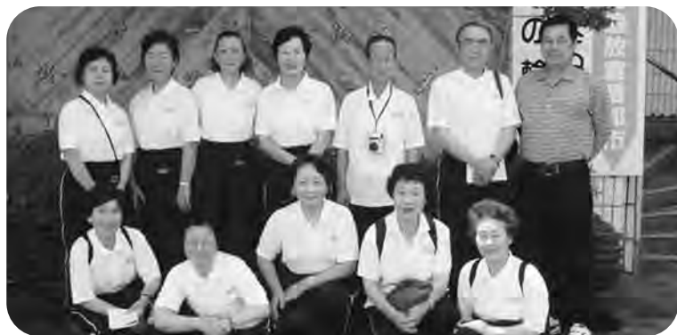
介護ボランティア「かもしか会」