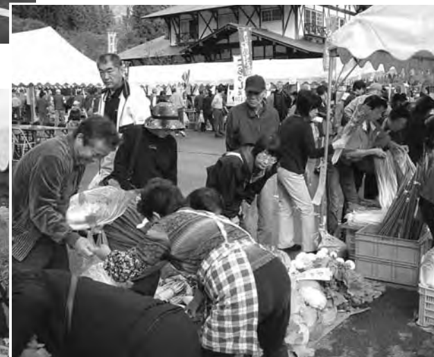
かのせ秋の産業まつり