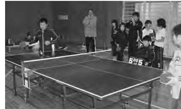
小学生シングルス