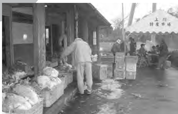
秋の味覚を堪能する来場者