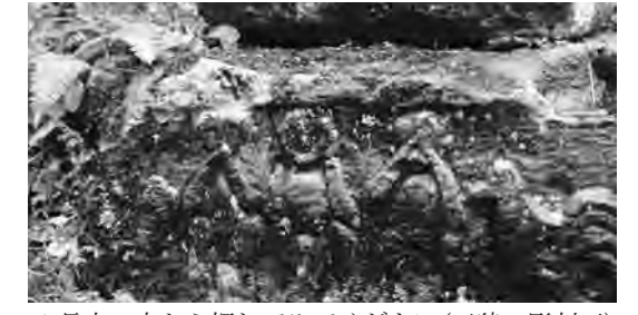
▲長木へ来たら探してみてください(三猿の彫刻石)