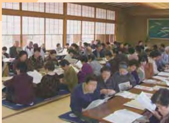
熱心に講話を聞く参加者

11月9日(金)、上川会館を会場に「上川地区老人クラブ連合会躍進大会」が開催されました。