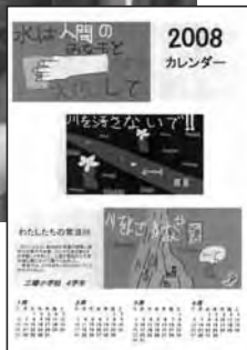
三郷小学校の児童が作成した カレンダー