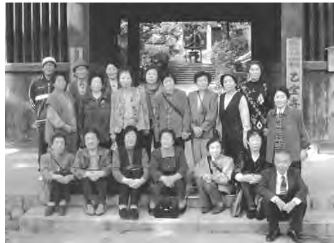
乙宝寺仁王門前で

胎内市乙宝寺、たいしたもん蛇まつりで有名な関川村へ移動し、国の文化遺産と伝説話、そして見事なまでに燃え盛る紅葉を堪能しました。