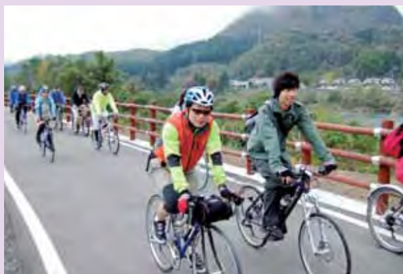
サイクリングを楽しむ参加者

参加者からは「交通量が少なく安全」「阿賀町にはいいコースがある」「走れるコースをもっと教えてほしい」との声が聞かれ、とても満足している様子でした。