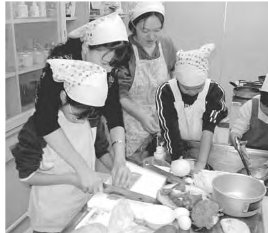
仲良く手作り料理

当日は、小学生の親子10組が参加。食生活改善推進員の皆さんを講師に迎え、パーティー料理に最適な簡単パエリアなど3品の料理に挑戦しました。子どもたちは、時おりお母さんから手伝ってもらいながらも上手に包丁を使い、楽しそうに料理をしている姿が印象的でした。また、試食の際には親子・友達同士笑顔で自作の料理に舌鼓をうっていました。