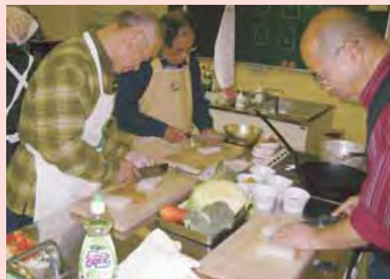
こんにゃくステーキ作りに挑戦

参加者は、食生活改善推進委員の指導のもと、栄養バランスの良いメニューを悪戦苦闘しながらも楽しそうに作っていました。