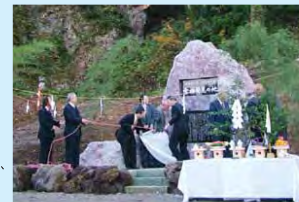
除幕を行う出席者

この記念碑は、以前麒麟山で「阿賀町の花」である雪樁が発見され、その学術的経緯を後世に残そうと筑波大学生物資源学類の同窓会「新潟駒場会」の会員らが建立したものです。当日は多くの関係者が見守るなか神事が執り行われ、参加者は記念碑の完成を祝いました。