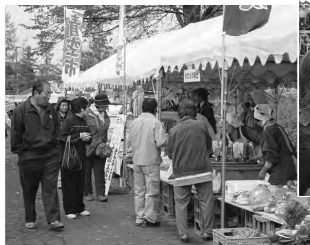
かみかわフェスティバル