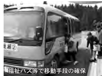
福祉バス等で移動手段の確保 ▲福祉バス運行事業・へき地巡回診療・敬老会式典