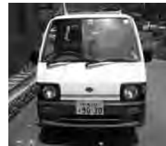
スバル軽トラック