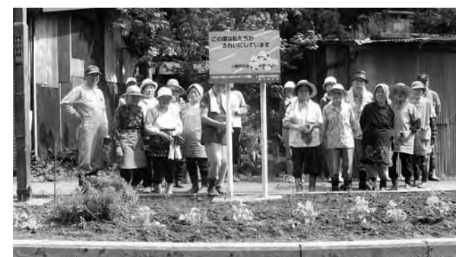
▲郷土はぐくみ事業

また、区では新潟県の「郷土はぐくみ事業」に協力し、毎年6月に県道西津川線の歩道植え込みに花苗約150本を植えて、道行く人の目を和ませています。