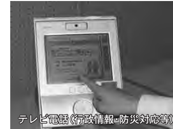
テレビ電話(行政情報・防災対応等) ▲情報ネットワーク整備事業・各種スポーツ振興