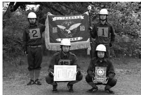
優勝した上川方面隊第3分団第1部の出場選手