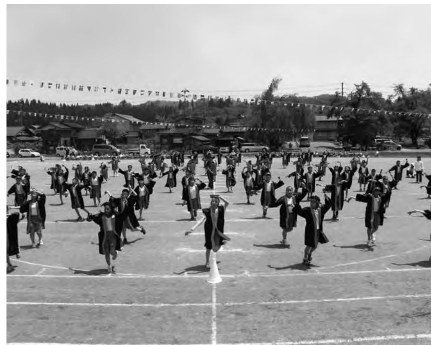
↑全校児童による「よさこいソーラン」

5月22日(土)に行われた、上条小学校の運動会。三宝分小学校と七名小学校が同校に統合されてから、初めての運動会となりました。学校も一つ、心も一つに、保護者の皆さんも含め、勝ち負けではない一致団結した姿がそこにはありました。