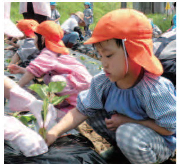
さつまいも苗植え体験