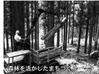
森林を活かしたまちづくり ▲環境保全・計画的な森林整備・間伐材等活用