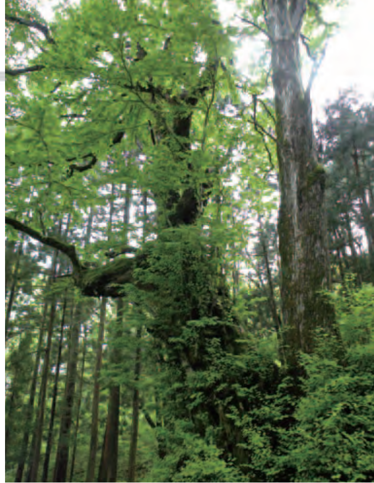
↑スケールの違いを感じさせる桂の木

多くの文人が往来したところでもある、会津街道筋に立つ「柳新田の桂」。樹齢推定300年のこの桂は、多くの先人たちを見つめ、いくつもの時代を乗り越えてきたのでしょう。森を覆うような巨木の葉が、照りつける太陽の日差しをやさしく届けてくれました。