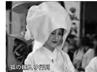
狐の嫁入り行列 ▲各地域のイベント・花火大会・ふるさとまつり