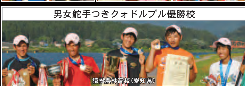
男女舵手つきクォドルプル優勝校