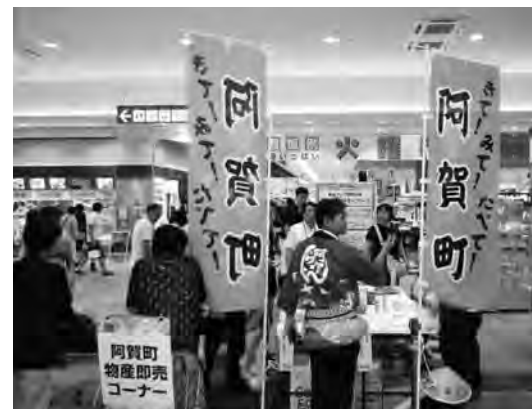
▲お客で賑わう物産即売コーナー

メイク体験は人数限定だったため、できなかった子どもが泣いてしまうハプニングもありましたが、イベントは大いに盛り上がりました。