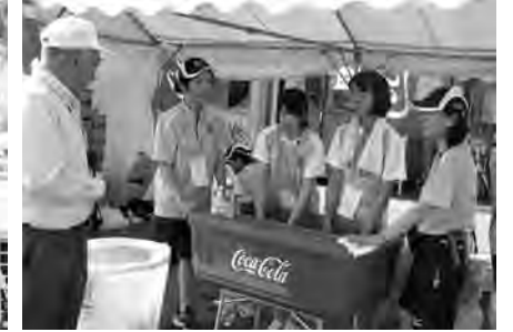
▲サンプリングの飲料水をひとつひとつお客様に笑顔で手渡していました