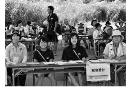
▲総合受付では、全国からの来場者に対して笑顔で丁寧に対応してくれました

今回のインターハイは、大勢の方からボランティアスタッフとしてご協力いただきました。連日の猛暑の中、頑張っていたボランティアスタッフの活躍を一部紹介します。