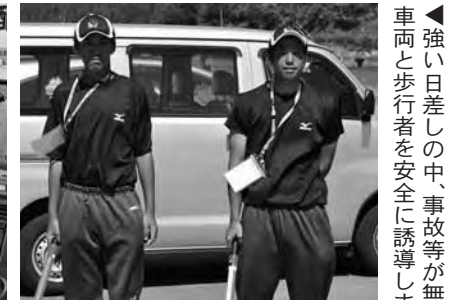
▲強い日差しの中、事故等が無いよう車両と歩行者を安全に誘導しました

この他にも、会場内のごみの収集やトイレの清掃、1,000個を超えるお弁当の配布など、様々な分野で大勢の方々からご協力いただきました。大会が無事終了することができたのボランティアスタッフの力があってこそです。皆さんありがとうございました。