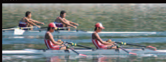
八百津工業高校(岐阜県)