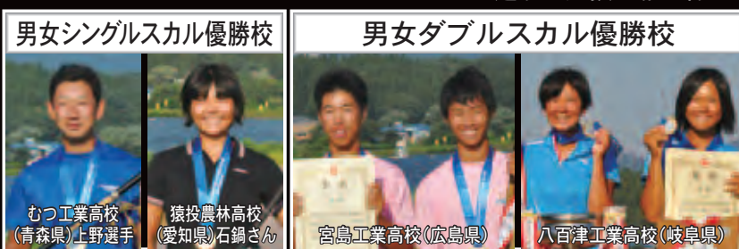
男女シングルスカル優勝校