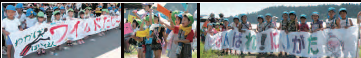
▲選手の応援に駆け付けた保育園児たち