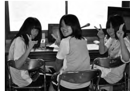
▲レースのスタートや途中経過など、場内の放送を担当してくれました