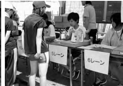
▲配艇係ではレースの進行に支障が無いよう細心の注意を払いました