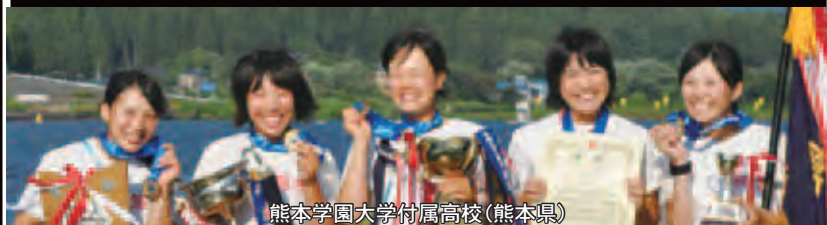
熊本学園大学付属高校(熊本県)