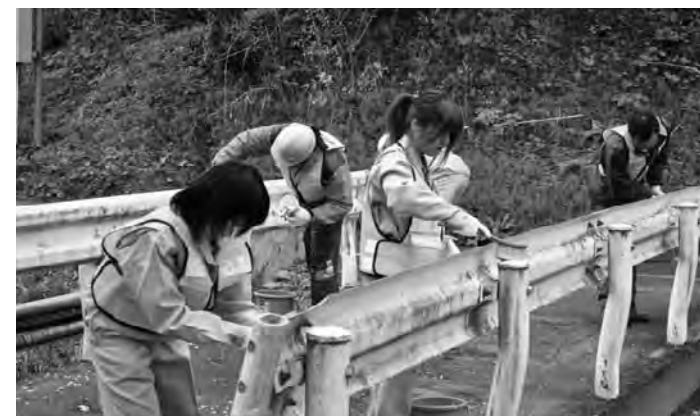
▲ガードレールもきれいに!

当日は、時折小雨が降るあいにくの天候でしたが、出発式で全員が「ガンバロー」と気合いを入れ、それぞれの持ち場でガードレールの清掃や道路沿いのゴミ拾いなどを行いました。