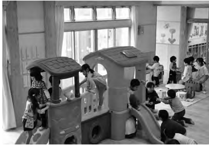
▲遊具で元気に遊ぶ子どもたち

園児たちは、「中庭が気持ちいい!」「おもちゃがたくさんあるんだよ!」と楽しそうに話してくれました。