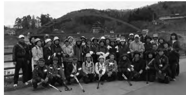
▲柳津町のシンボル「柳津橋」をバックにパチリ!