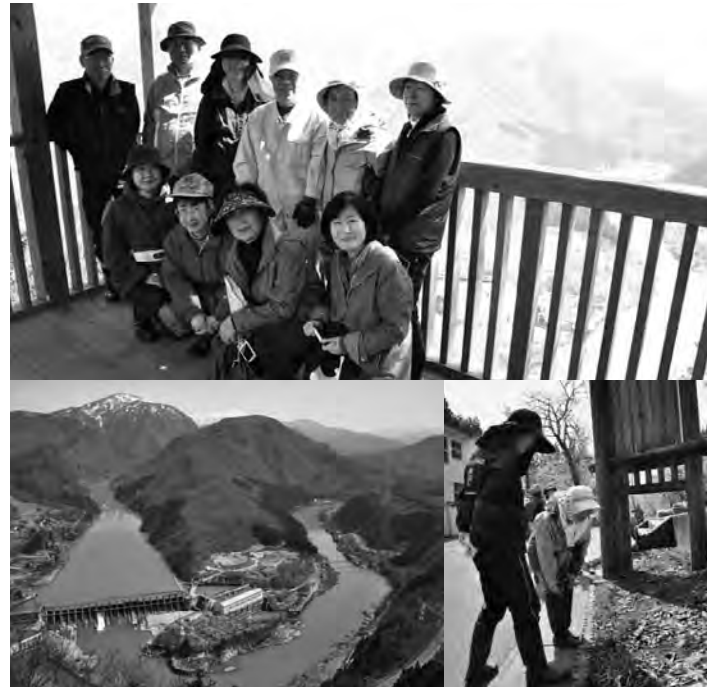
▲展望台からの眺望