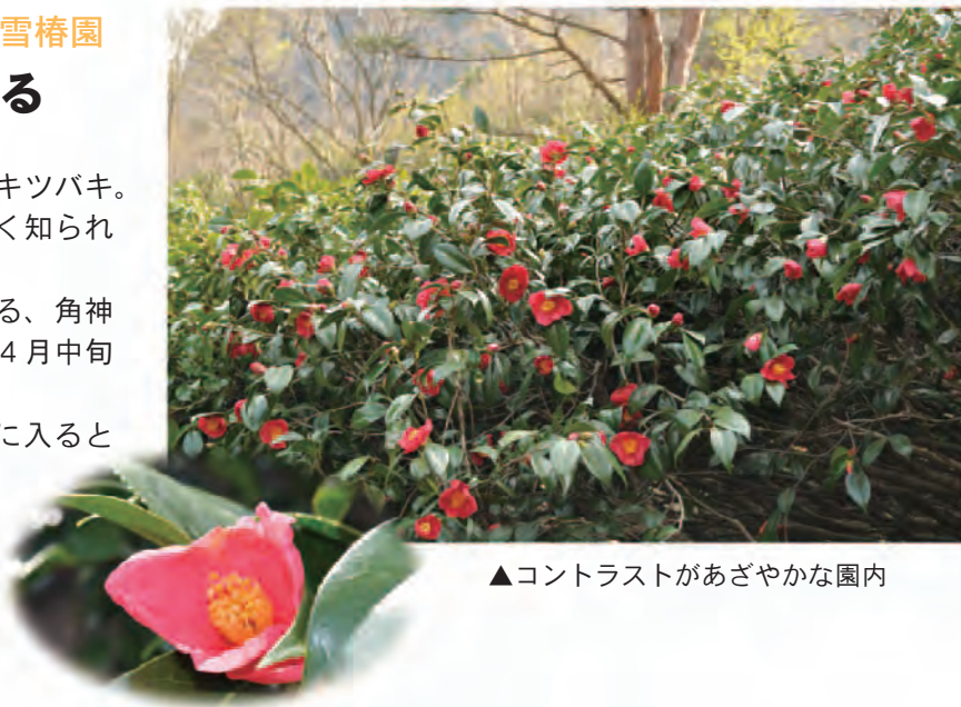
▲コントラストがあざやかな園内