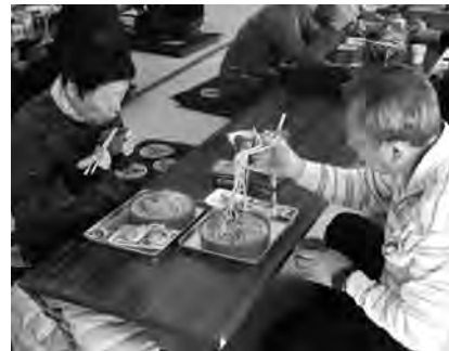
▲新そばの風味を楽しむ来場者

また、当日は石州流翠風会 庄司社中による茶会も開催され、親子連れなどがのんびりと薄茶とお菓子を楽しんでいました。