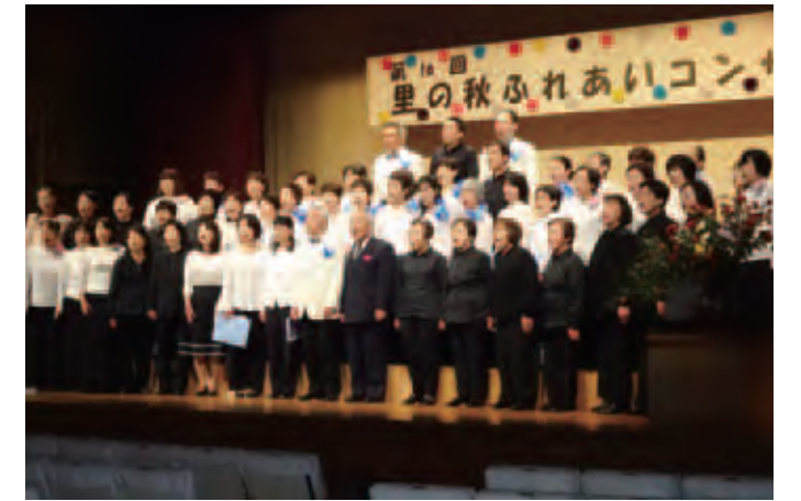
▲美しいハーモニーを披露

コンサートの最後には会場の全員で「ふるさと」を合唱して終演となり、美しいハーモニーを堪能した晩秋の1日となりました。