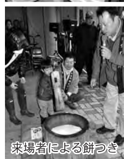
来場者による餅つき