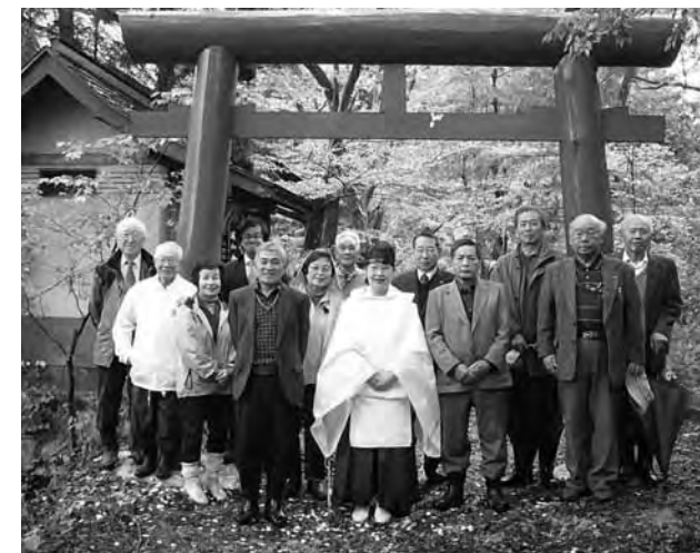
▲再建された鳥居の前で

イベントでは、町内の18温泉施設の日帰り入浴が無料になる催しや、豪華景品が当たるシール付の振る舞い菓子、餅つきなどのほか、町の特産品を並べた販売コーナー、牛すじ煮込み鍋や手打ちそばなどの飲食コーナーが設けられ、会場を訪れた人たちは漬け物や新米、地元産野菜などを買って求めたり、温かい汁物や手打ちそばなどを味わっていました。