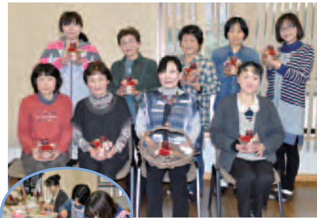
▲クリスマスらしい華やかな作品が完成しました