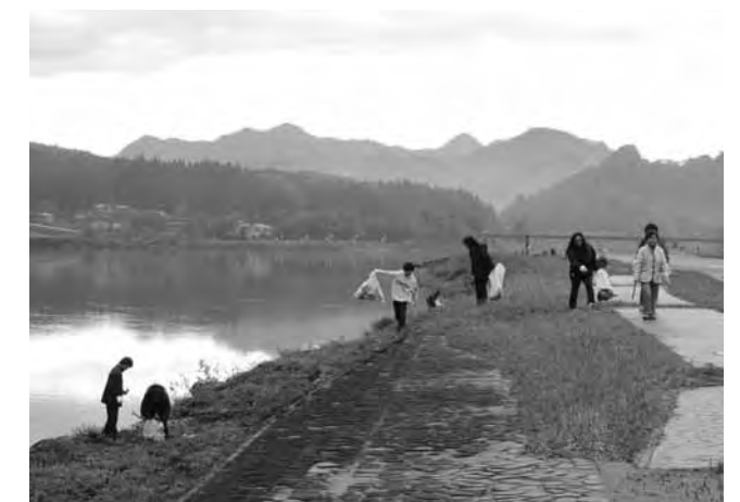
▲ていねいにごみを拾う参加者

参加した子どもたちは、「いつもここで練習ができることに感謝して、ごみを1つも残さないようにがんばります。」と袋いっぱいにごみを拾い集めていました。