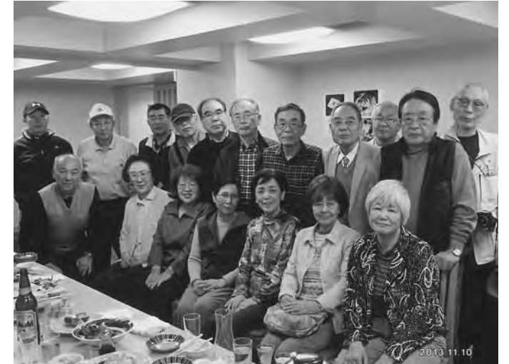
▲日帰りの旅に参加した皆さん

その後団子で有名な言問橋を渡り、隅田川沿いに東京スカイツリーを対岸に見ながら、ゴールの水上バス発着所に正午過ぎに到着。船下りから参加した4人を含めて18人で隅田川の船下りを楽しみました。