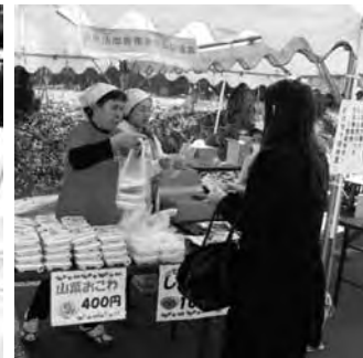
▲地元のおいしいものが並びました