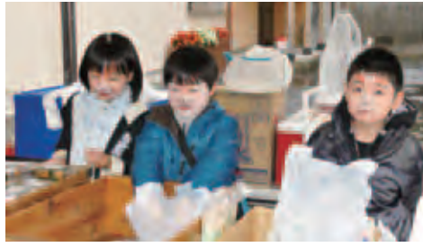
▲津川小3年の児童たちは狐メイクでお手伝い(上) 新潟大学の学生によるキャンドル作りコーナー(下)