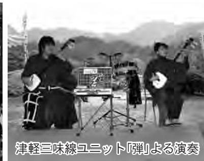
津軽三味線ユニット「弾」による演奏