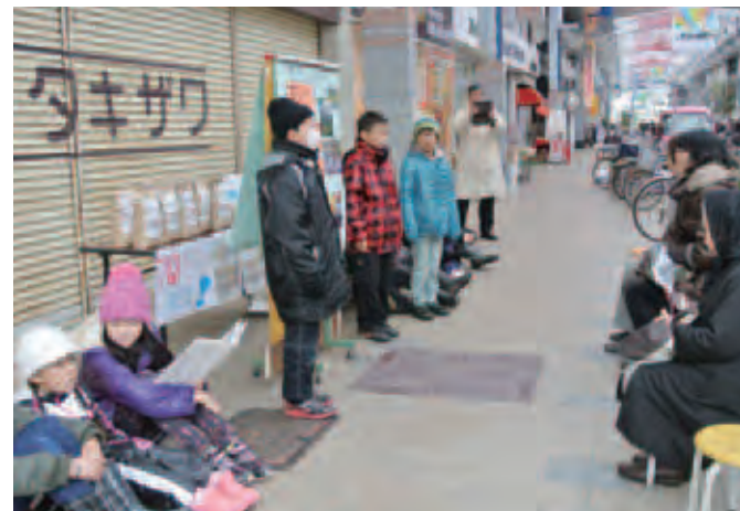
▲新潟市内の人たちに取り組みを説明する児童たち

また、この日はテレビ局が取材に訪れていて子どもたちは緊張しながらもしっかりとした口調でインタビューに答えていました。