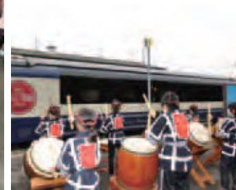
▲勇壮な太鼓でSLを見送り