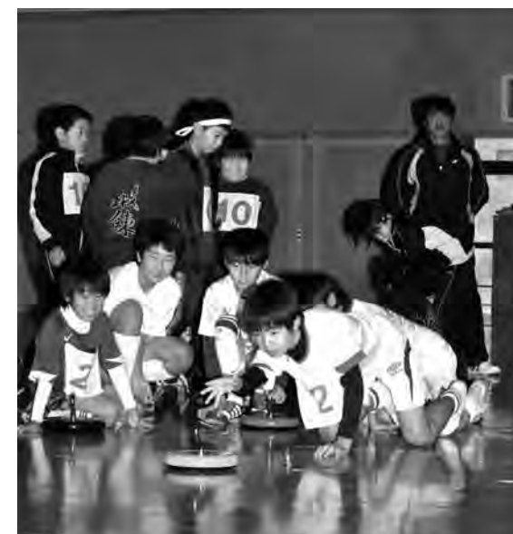
▲高い得点エリアをめがけて…

挑戦した参加者の中には、強く投げすぎて得点ゾーンを通過してしまったり、慎重になりすぎてかなり手前で止まったりするなどの珍プレーが続出して、会場の笑いを誘っていました。