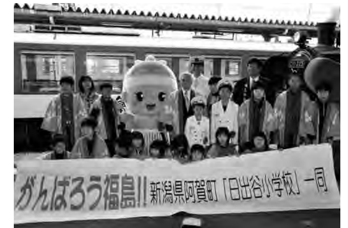
▲福島県のゆるキャラと記念撮影

最後に福島県のゆるキャラたちと記念撮影を行い、これからも交流をしていこうと誓いました。