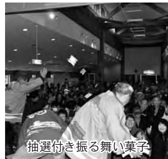
抽選付き振る舞い菓子