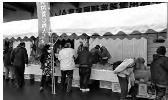
▲即売会開始とともに大勢の人が来場しました

自然薯は「山菜の王者」とも言われ、栄養価も高く阿賀町の特産品の一つとして広く知られています。会場には贈答用のものから手頃な大きさにカットされた自家用のものなどがテーブルいっぱいに並び、朝から大勢の人が来場して自然薯や地元の農産物などを買っていました。