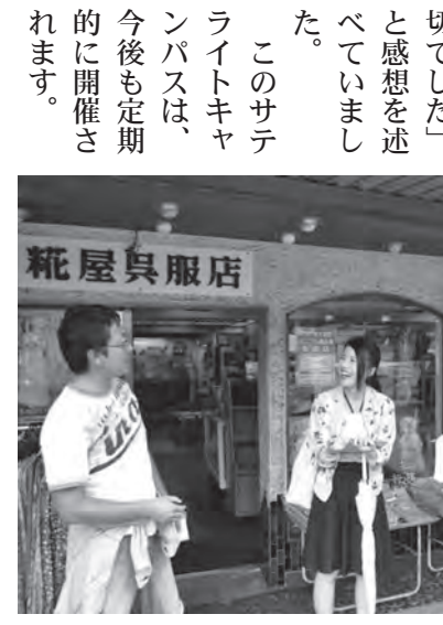
▲街歩きをする学生の皆さん