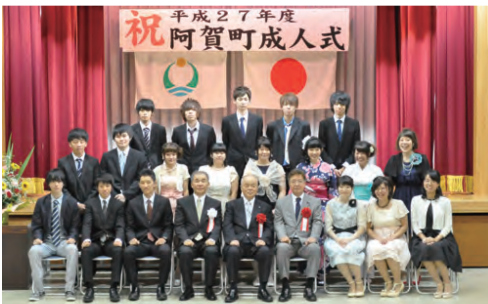
阿賀黎明中学校卒業の新成人