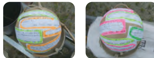
▲メッセージが貼られた「白菊」の花火玉

戦後70年の今年、鹿瀬会場では先人への感謝と恒久平和の願いを込めて、花火「白菊」が打上げられ、夏の夜空に白い大輪の花が咲きました。