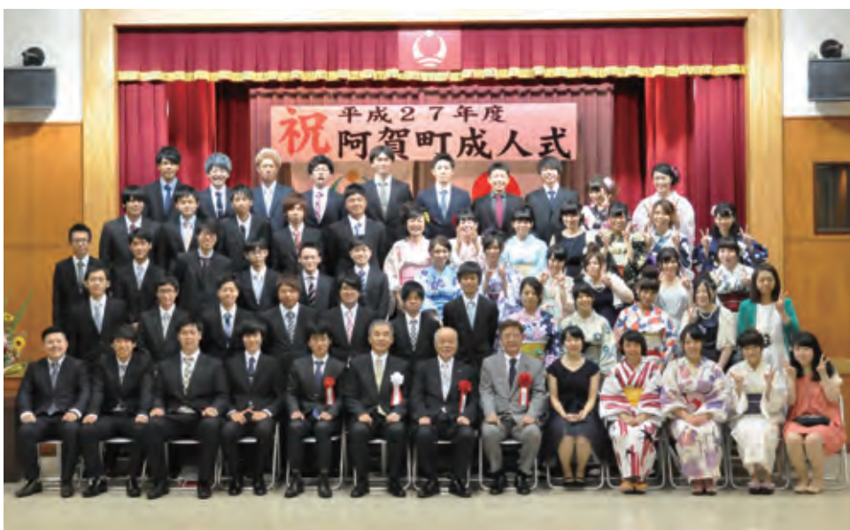
阿賀津川中学校卒業の新成人