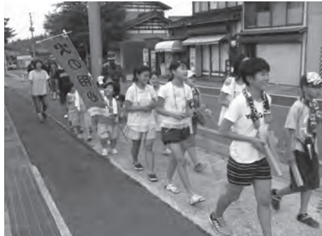
▲「火の用心」を呼びかける児童