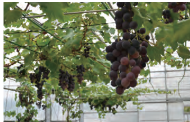
▲たわわに実ったぶどう