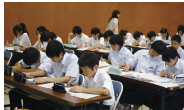
▲中学生「数学オリンピック」