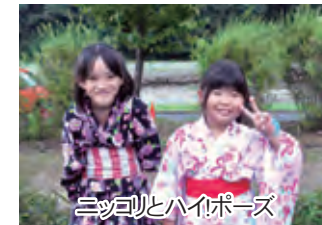
▲ミッソリとハイポーズ