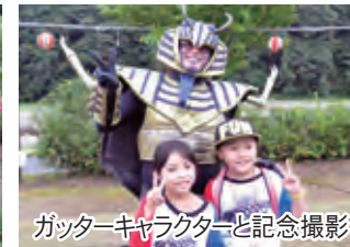
▲ガッターキャラクターと記念撮影