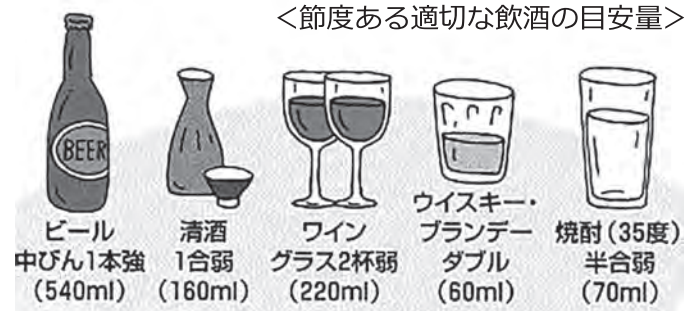
<節度ある適切な飲酒の目安量>

あなたの大切な人が、「もしかして自殺を考えているかも…」といった印象を受けたら、早めに専門の相談機関や医療機関へ繋ぎましょう。