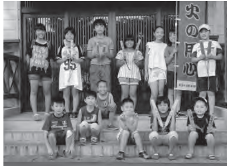
▲みんなで記念撮影