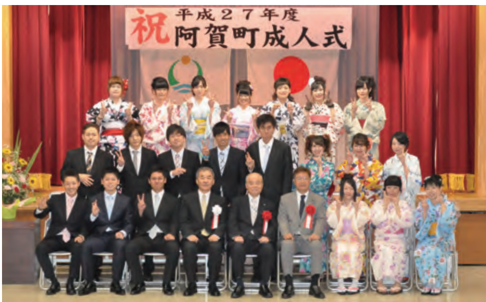
三川中学校卒業の新成人