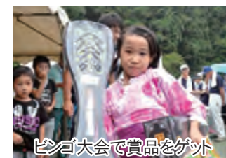
▲ピンゴ大会で賞品をゲット