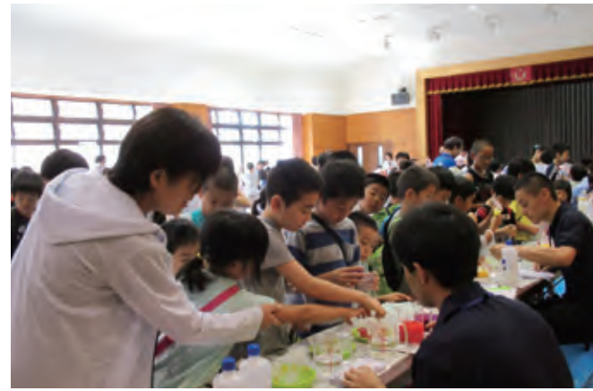
▲大盛況のわくわく科学体験