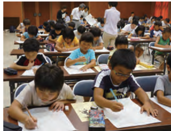
▲小学生「おもしろ算数デー」

小中学校の夏休み期間中に、阿賀町公民館で学習イベントを開催しました。小学生は「おもしろ算数デー」で、計算名人認定テスト、タングラムパズルに取り組みました。中学生は「数学オリンピック」で、数学の難問に3人チームで挑戦しました。子どもたちの積極的に学ぼうとする姿が大変印象的なイベントとなりました。また教員も「サマー研修」と称し、子どもの理解や学級経営の方法について、講演会を基にグループ協議をして研鑽を積んでいました。