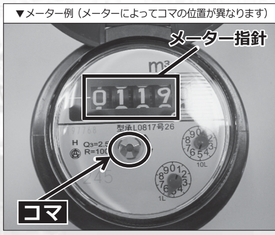
▼メーター例（メーターによってコマの位置が異なります）

ご家庭内の水道蛇口を全てしめた状態でメーターを確認してください。コマが回転している場合は蛇口以外から水が漏れていることとなります。