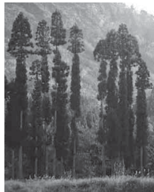
第15回 阿賀町長賞 受賞作品