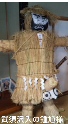
武須沢入の鍾馗様