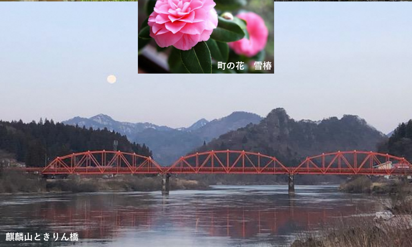
麒麟山ときりん橋